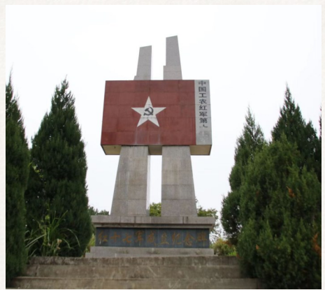
矗立在通山县大畈镇隐水村黄石洞的红十七军成立纪念碑。

1930年7月上旬,中共鄂东特委和红八军后方留守处,以留下红军和后方医院病愈的部分红军官兵为骨干,将薪、黄、广地区在阳新百佛山整训的鄂东游击大队和新参军的阳新战士,合编为红八军第四纵队,全