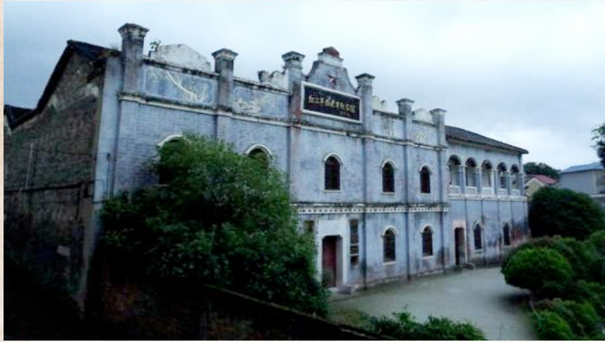
在鄂东南转战中发展起来的红八军与彭德怀率领的红五军主力在湖北省大冶县刘仁八村成立红三军团,此为刘仁八村红三军团成立旧址。