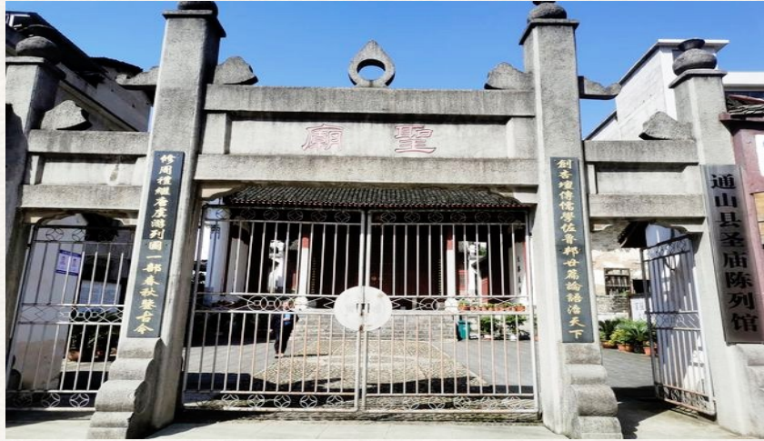
彭德怀率红三军团入驻通山,并在通山圣庙召开前敌会议,决定南下攻取岳州(岳阳),剑指长沙,此为通山圣庙。