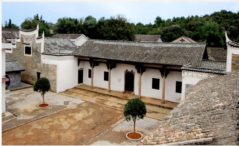
红三军团退出长沙后与毛泽东率领的红一军团在浏阳汇合后成立中国工农红军第一方面军,也就是后来的中央红军,此为红一方面军成立旧址——浏阳李家大屋。