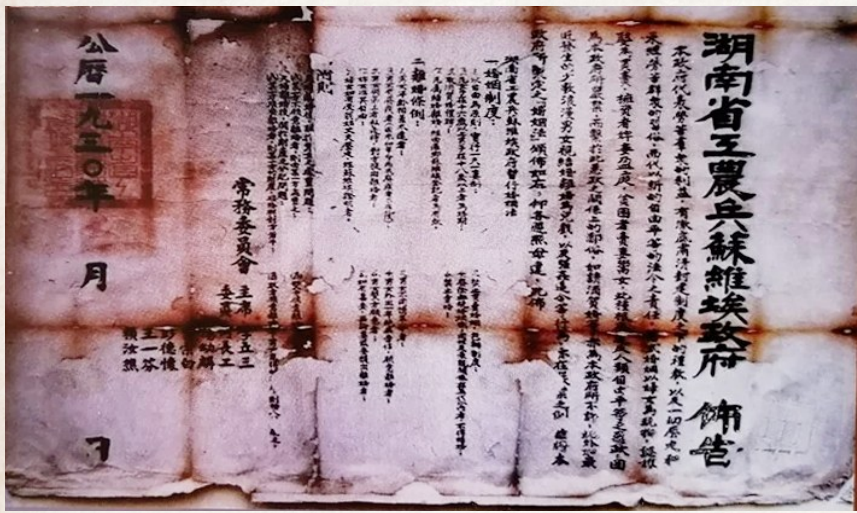
红三军团夺取长沙后在长沙成立湖南省苏维埃政府,此为发布的首张布告。