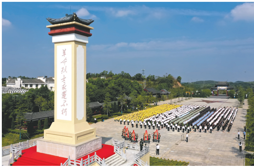
9月30日,咸宁市烈士纪念日公祭活动在鄂南烈士陵园举行。

在阴森恐怖的监狱中,何功伟烈士遭受了敌人惨无人道的折磨。每一次严刑拷打,都如狂风骤雨般猛烈冲击着他的身体,但他心中的信仰却如磐石般坚定;每一次威逼利诱,都如毒