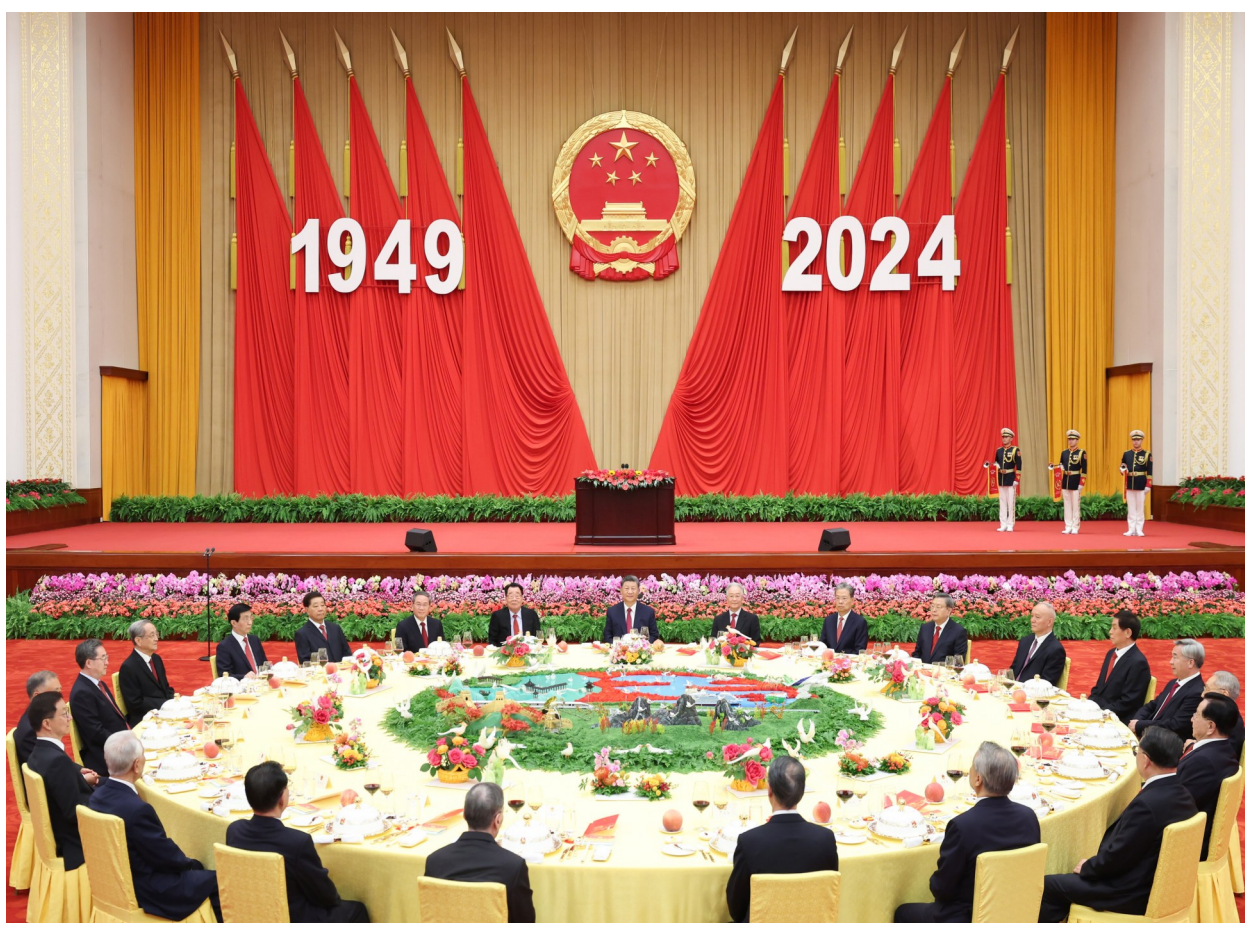
9月30日晚,庆祝中华人民共和国成立75周年招待会在北京人民大会堂隆重举行。习近平、李强、赵乐际、王沪宁、蔡奇、丁薛祥、李希、韩正等党和国家领导人与约3000名中外人士欢聚一堂,共庆新中国75周年华诞。

新华社北京9月30日电 庆祝中华人民共和国成立75周年招待会30日晚在人民大会堂隆重举行。中共中央总书记、国家主席、中央军委主席习近平出席招待会并发表