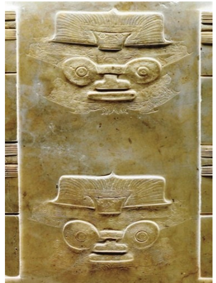
良渚文化反山M12玉琮局部

玉文化考古为读者打开了一个全新的世界。玉华帛帛,玉根国脉,玉成中国。(原载《天津日报》,作者为王小柔)