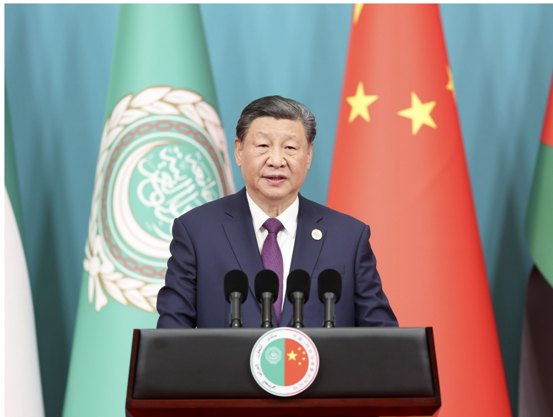
5月30日上午,国家主席习近平在北京钓鱼台国宾馆出席中阿合作论坛第十届部长级会议开幕式并发表主旨讲话。