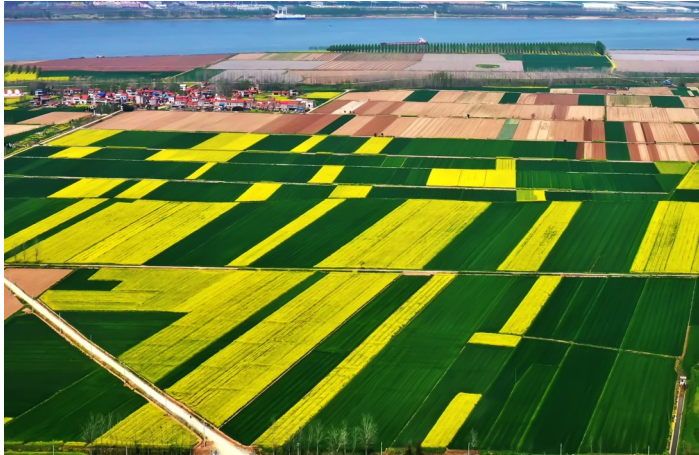
嘉鱼县簪洲湾镇,大地五彩斑斓。

片的油菜花海迎着朝阳,美丽绽放;登至山顶,洁白如玉的野樱花点缀着山峦,游人如同前来赴约一般,笑容满面的记录着自己和春天的约会。 徜徉在鄂南大地,穿行于香城的大街小巷,每一处都是美景,每一步都让人流连忘返。 因花而游,因花而乐。咸安向阳花海文旅活动、嘉鱼桃花节、赤壁葛仙山“樱花季”……内容、形式多样的活动在这个春季如约而来,如花香洒满香城各地,“赏花经济”的花期也越来越长。 春有约,花不误,来咸宁共赴一场春天的约会吧!