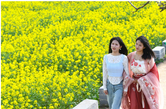
咸安区马桥镇油菜花海景区,游客在花海中游玩。