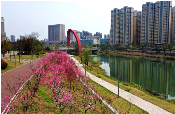
城区淦河大桥附近,桃花烂漫。