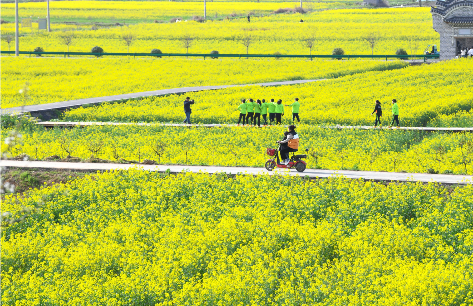
咸安区马桥镇油菜花海景区,游客打卡。

迟日江山丽,春风花草香。 铺天盖地的油菜花,婀娜多姿的樱花,粉中带白的玉兰花……阳春三月,鄂南大地,花香十里,进入了一年中的最佳赏花期。 清晨,走出家门,温暖的春风吹起,缀满枝头的细碎小花似一阵柔软的金色花瓣雨,无声地飘然洒落,落在发间,落在眉梢。美好的一天,从微风、鸟语、花香开始…… 行至人民广场,颜色鲜艳的花儿一团团、一簇簇簇拥着你,空气里伴着阵阵花香,碧绿的枝叶映衬着点点花瓣,春天的诗意与美感不言而喻。 驱车行驶至大幕山山脚下的自然盆地,大