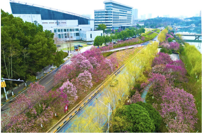
城区双鹤路,花红柳绿,春意盎然。