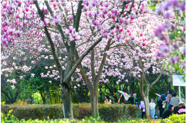
市人民广场,玉兰花开,美若仙境。