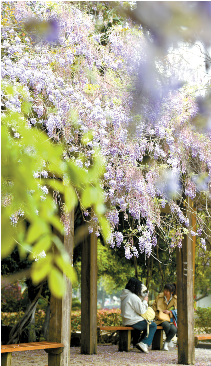
市中心医院小广场前,紫藤花盛开。