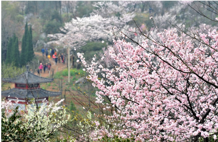
赤壁市官塘驿镇葛仙山景区,樱花怒放。