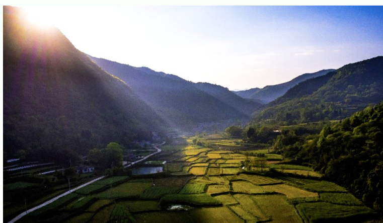
森旺农业休闲基地