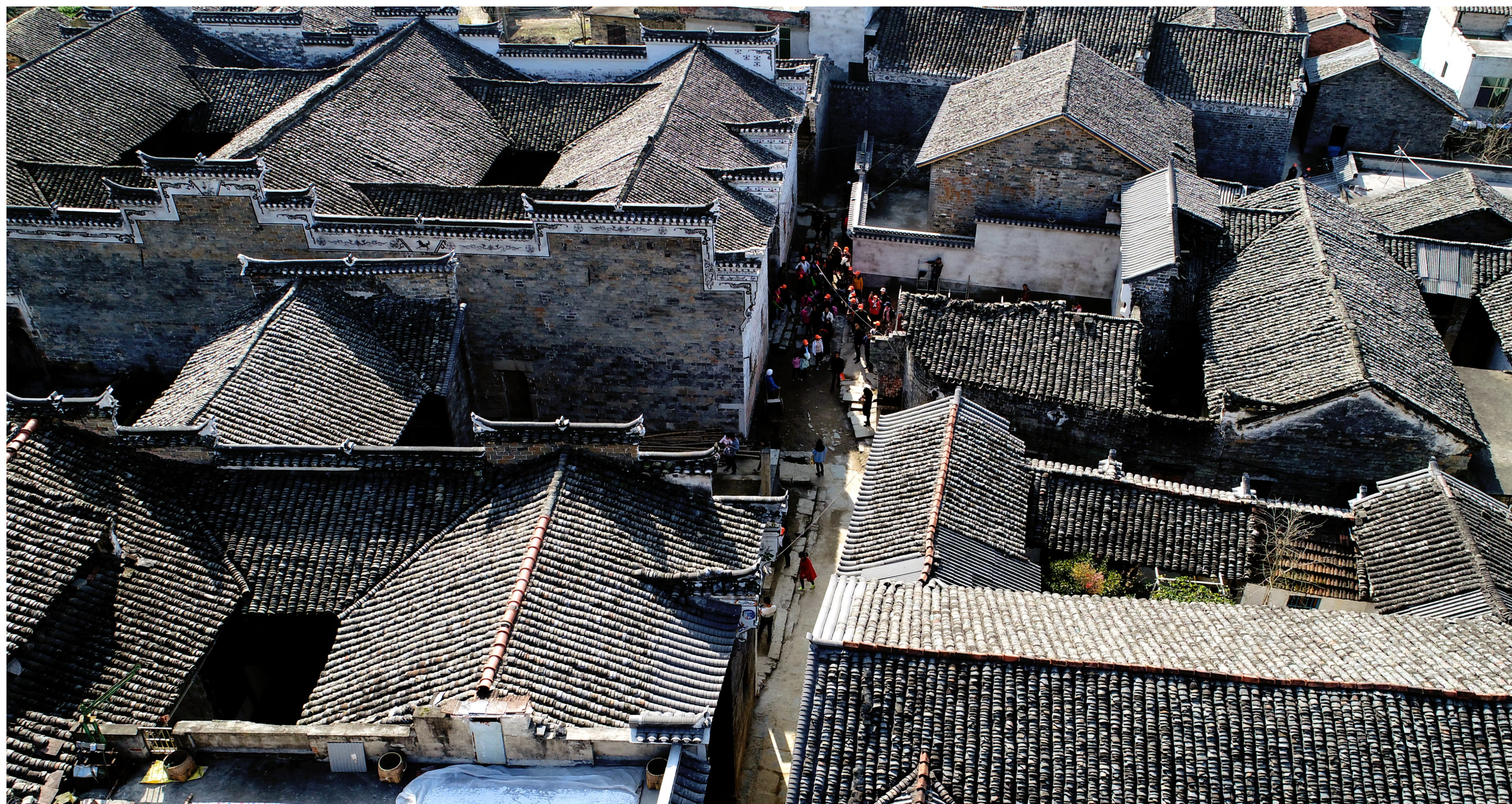
2018年11月24日,南林桥镇石门村,一批游客在古民居里游玩。