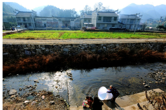
2023年12月27日,洪港镇江源村,村民在溪流边浣洗。

如今,一个个古韵悠悠的传统村落,宛如一颗颗散落的珍珠,点缀在通山青山绿水之间,它们如同珍贵的历史长卷,凝固着历史与文化的记忆,唯有珍视这份历史与文化,才能让这唯美的韵致在岁月的长河中永存。