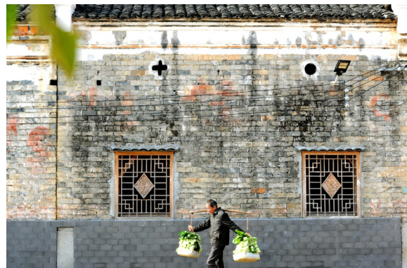
2023年12月13日,厦铺镇厦铺村,一名老人满载蔬菜而归。