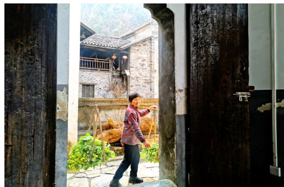
2024年3月19日,南林桥镇石门村,一名老人挑着菜从老屋门口经过。

青瓦白墙寻古意,传统韵味扑鼻间。 3月19日,晨光熹微,走进通山县南林桥镇石门村,青山环绕、云雾缭绕。行于茶马古驿之上,两侧农田青蔬长势良好,清风拂过,油菜花随风摇曳。——长夏畝古民居映入眼帘。