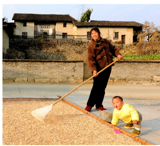
2023年12月27日,闯王镇宝石村,村民在老屋前翻晒干菜。