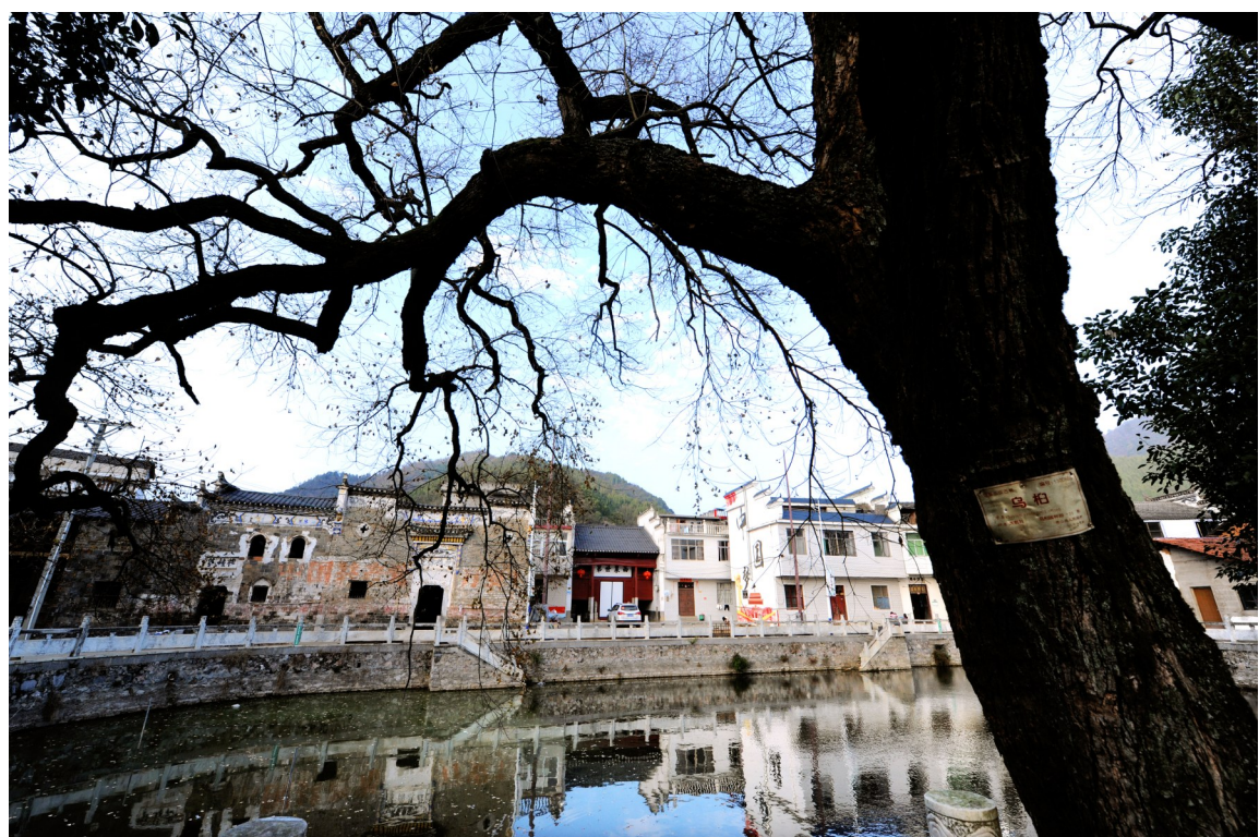
2023年12月13日,大畈镇西泉村,百年古树见证着村湾的变化。

通山县现存具有研究、观赏、保护开发价值的明清民居群落30余处,入选“中国传统村落”名录13个(全市27个),占全市的48%;全国第三次文物普查登录的明清时代建筑272处;拥有古民居类各级文物保护单位74处,其中:国家级1处、省级10处、市级39处、县级24处,入选2022年全国第一批传统村落集中连片保护利用示范区。