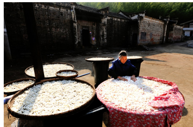
2023年12月31日,黄沙铺镇上坳村,一名村民在家门口晾晒萝卜干。