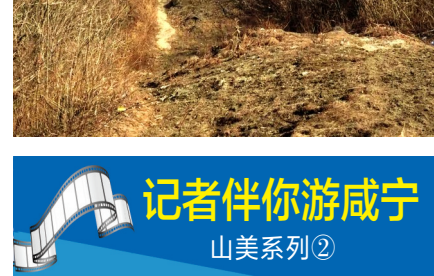
记者伴你游咸宁 山美系列②