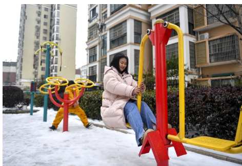
近日,在天洁知书城小区内健身器材处,市民正开心地健身。