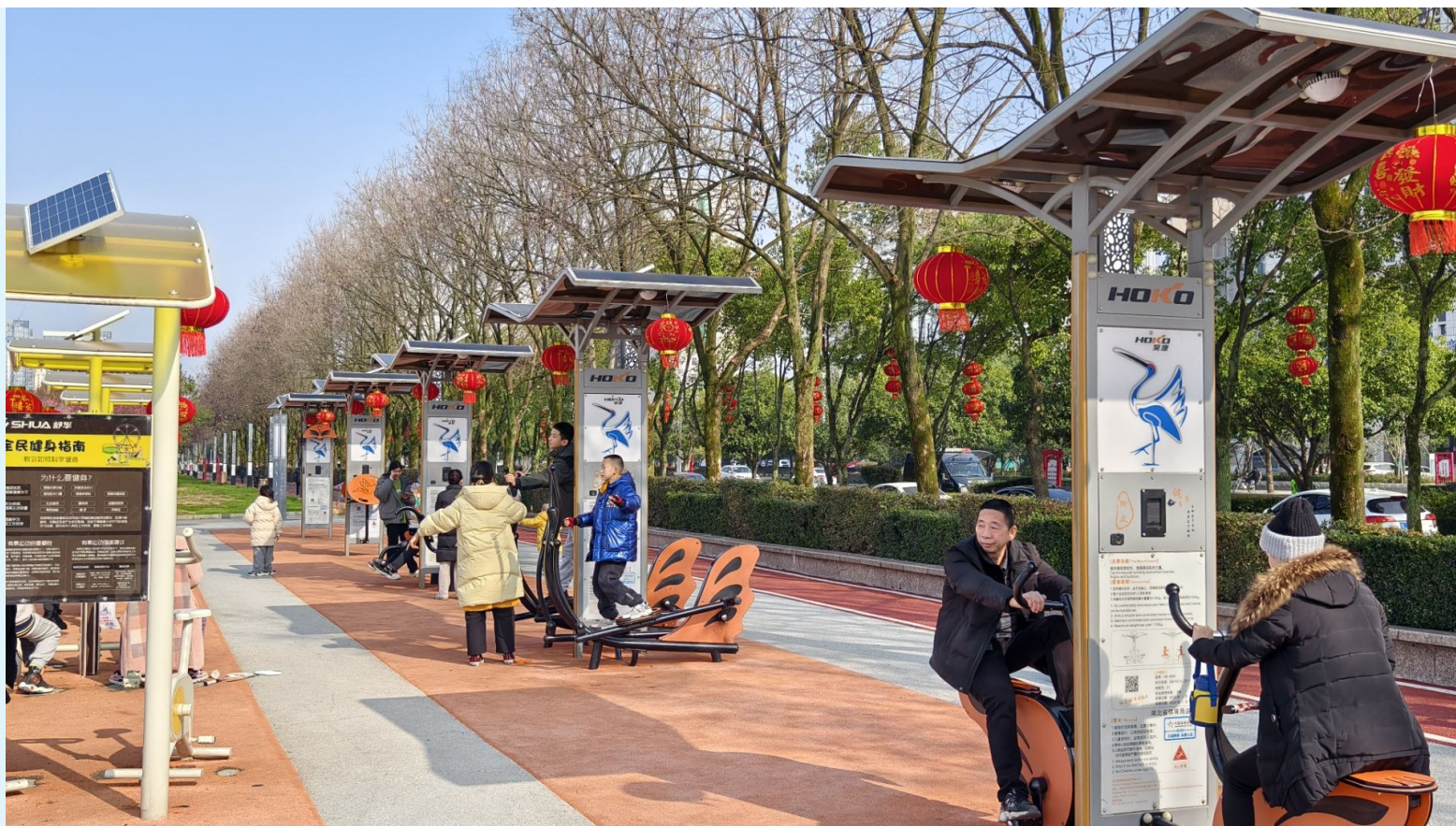
日前,市人民广场健身器材区成为市民茶余饭后休闲健身的好去处。

小区里,居民朋友正挥汗如雨地上篮;广场上,老人们体验着智能的健身器材;公园绿道上,市民闲庭信步……在咸宁,老百姓尽情享受家门口的健身运动带来的放松与快乐,“快乐健身”已然成为群众生活的常态。