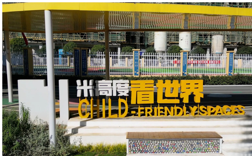
获奖项目一角。

来,六届广州奖汇聚了101个国家653个城市和地方政府的1635个案例。其中,本届有来自54个国家193个城市274个项目参赛。 当晚,咸宁跻身全球5个获得“广州奖”的城市名单,成为继杭州、武汉、重庆之后,第四个获此殊荣的中国城市。并以近208万票高居榜首,获得“网络人气城市”称号。 咸宁缘何能从激烈的竞争中脱颖而出,成为15个入围城市中唯一的中国城市,并通过精彩的答辩荣登榜单?