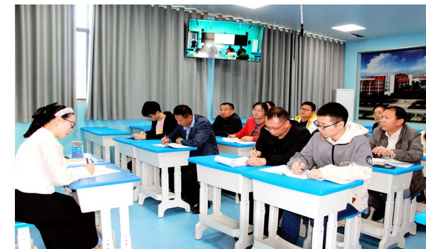
大集中学集体备课