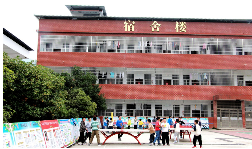
天城中学高视分校宿舍楼