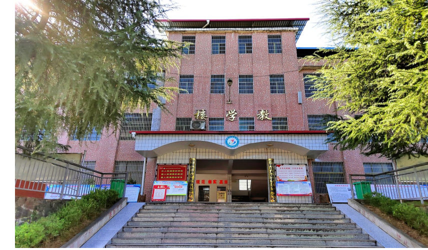
大集中学金塘分校教学楼