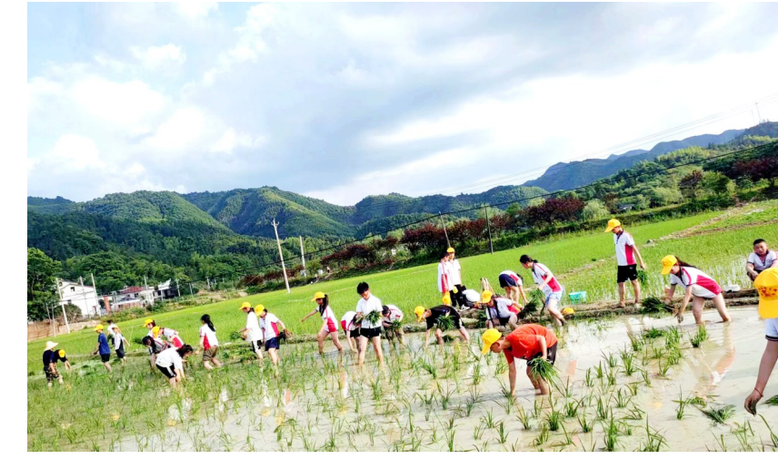
实验小学社会实践