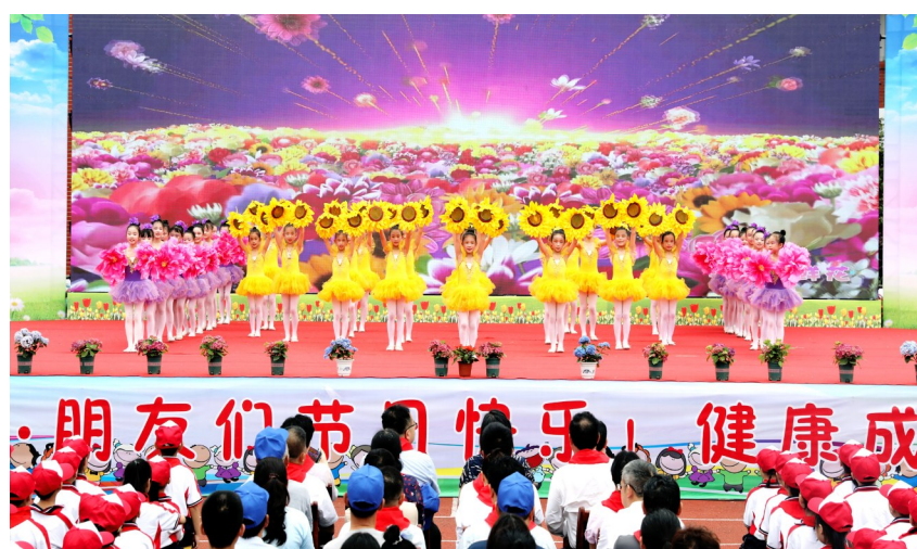
实验小学“六一”文艺演出