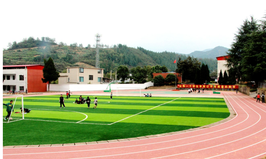
大集中学金塘分校运动场