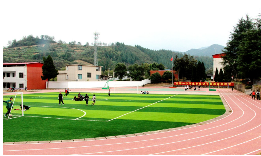
大集中学金塘分校运动场