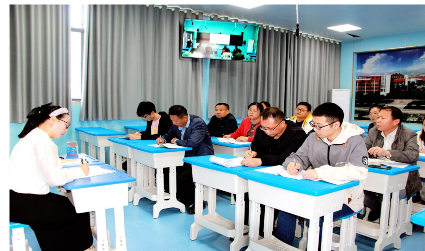
大集中学集体备课