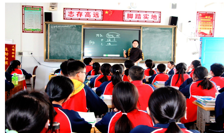
大集中学语文课堂