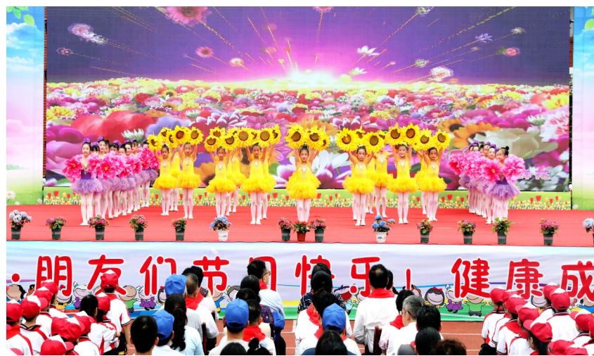
实验小学“六一”文艺演出