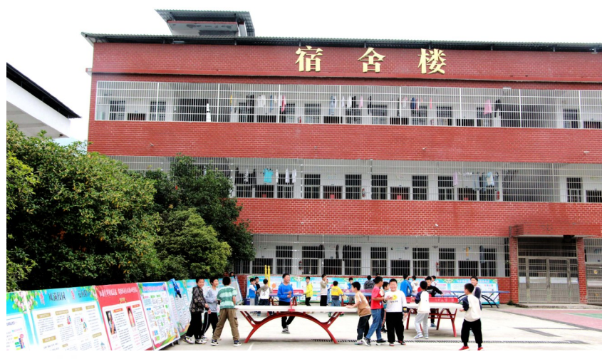
天城中学高视分校宿舍楼