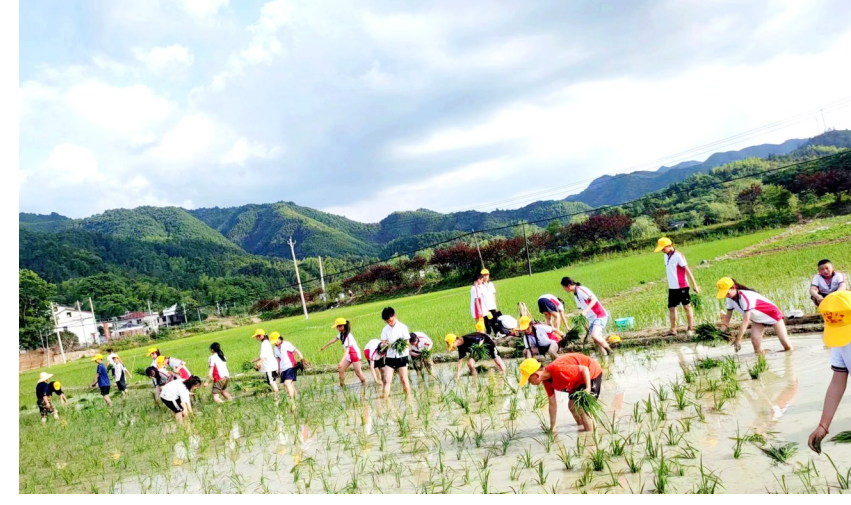
实验小学社会实践