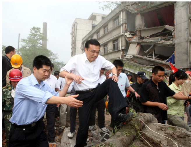
2008年5月19日,李克强同志在四川地震灾区察看灾情。