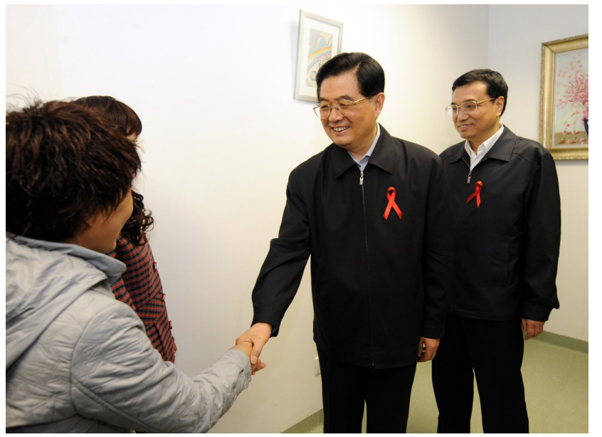
2008年12月1日是第21个世界艾滋病日。胡锦涛同志和李克强同志来到北京地坛医院考察艾滋病防治工作。