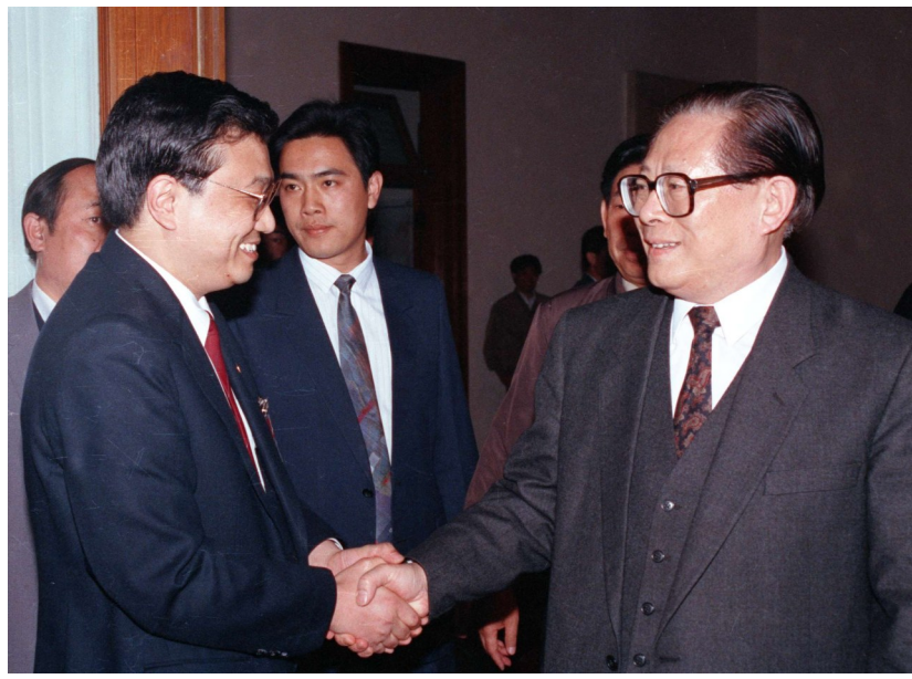
1993年5月3日下午,中国共产主义青年团第十三次全国代表大会在北京人民大会堂开幕。在5月3日上午的预备会议后,举行第一次主席团会议,推选李克强等同志为主席团常务主席。这是江泽民同志与李克强同志握手。 据新华社