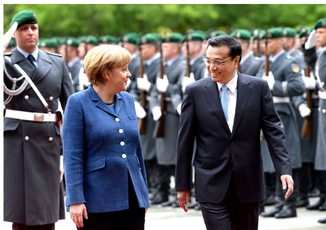
2013年5月26日,李克强同志在柏林出席德国总理默克尔举行的欢迎仪式。