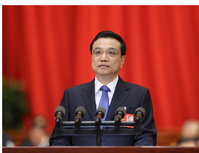
2014年3月5日,第十二届全国人民代表大会第二次会议在北京人民大会堂开幕。李克强同志作政府工作报告。 据新华社