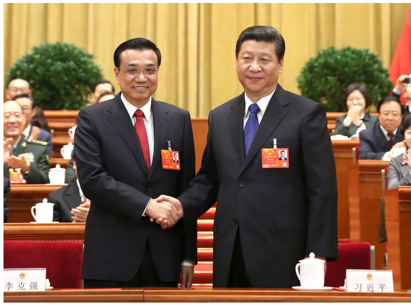
2013年3月15日,第十二届全国人民代表大会第一次会议在北京人民大会堂举行第五次全体会议。会议经过投票表决,决定李克强为中华人民共和国国务院总理。这是习近平同志和李克强同志亲切握手。 据新华社