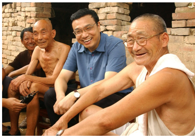
2003年8月8日,李克强同志在河南省新乡市调研。这是李克强同志在原阳县桥北乡马庄村与村民亲切交谈。