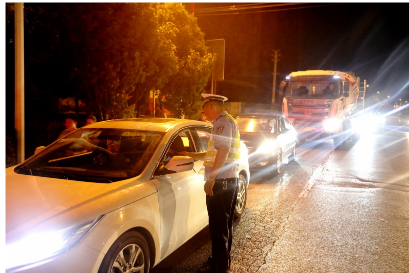
交警大队民警在重点路段严查酒驾醉驾

责人表示,通过悬挂条幅标语、电子屏幕滚动播放、交通安全宣传进农村、交通安全宣传进企业、交通安全宣传进校园和路面执勤劝导等方式,努力营造“全方位、多层次、多领域、系统化”的良好宣传氛围,不断提高群众的交通安全意识。