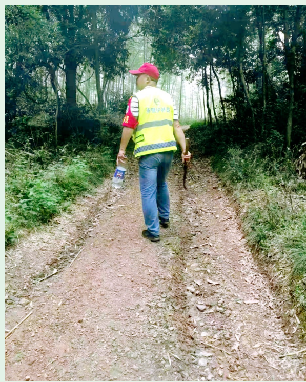
爱绿护绿你我同行 讲好巡林护林故事