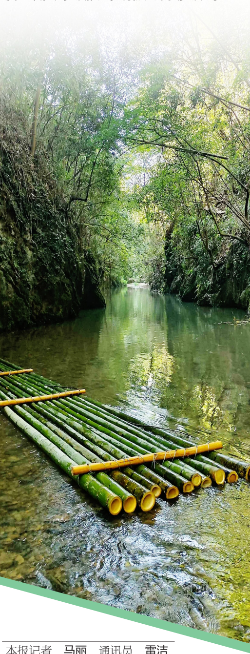
本报记者 马丽 通讯员 雷洁

仅去年,全镇获得上级表彰表扬26项,包括官塘驿镇派出所获评“一级公安派出所”,张司边村被表彰为全省“十佳村民委员会”,独山村入选“湖北省美丽乡村试点村”,西湾村获评“湖北省综合减灾示范村”,官塘驿镇入选咸宁市“2021年度全市涉农乡镇推进乡村振兴十强乡镇”等。