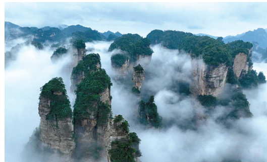
近日,湖南张家界武陵源雨后云海漫卷,如诗如画。百龙天梯伫立云端,仿佛飘浮在云海仙境之中。图为云雾缭绕山峰之间,蔚为壮观。