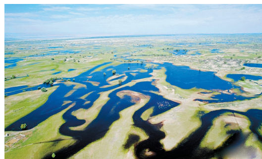
近日,新疆阿勒泰克苏湿地国家级自然保护区呈现如画美景。新疆阿勒泰克苏湿地国家级自然保护区是集河流、湖泊、沼泽、草甸、草原、荒漠等多种生态景观类型于一身的重要的复合生态系统。