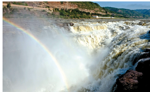
近日,随着上游来水量减少,黄河晋陕峡谷水位回落,壶口瀑布落差加大,呈现出“清流飞瀑”和彩虹美景,吸引了众多游客前来观看。