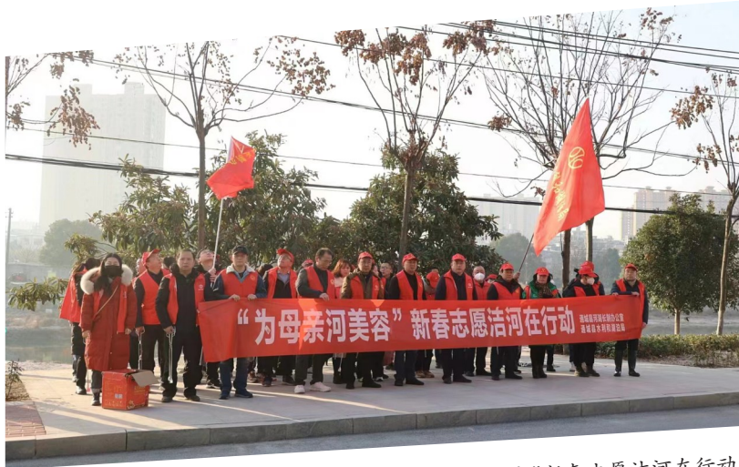
“为母亲河美容”新春志愿洁河在行动

资金2000余万元,因地制宜合理选取苗木品种,推进隽水河、秀水河、铁柱港等20多处河堤绿化改造升级,完成河岸绿化面积1000余亩。从移民美丽家园示范创建入手,县水利部门每年向上争取一批项目,精心规划设计,让水库绿起来。2022年,投入资金近1000万元,在通城最大的中型水库云溪水库库区,对关刀镇的高桥、云水等村开展绿化工程建设,改善水库周边环境。 “春风遍绿河岸。”河岸绿化工程,为通城县生态筑牢了绿色本底,增添了无限生机。