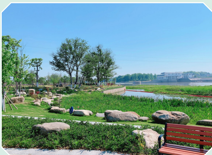
隽水河湿地公园一角