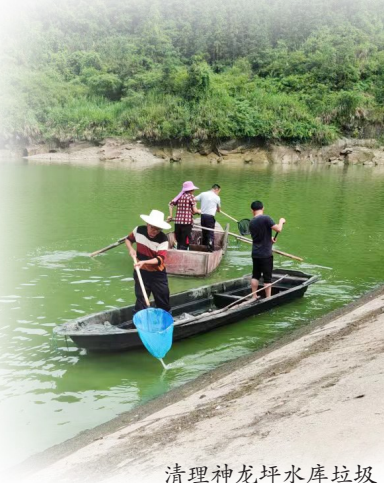
清理神龙坪水库垃圾

让河岸“美”起来。近年来,通城县委、县政府始终把民生福祉摆在突出位置,在城区河道生态治理PPP项目中投入5.19亿元,不断提升人民群众的获得感、幸福感。 “无边风景入画图。”如织的游人已成为河边的一道风景,在戏水亲水的体验中,爱水护水节水已逐渐成为人们的生活理念和习惯。