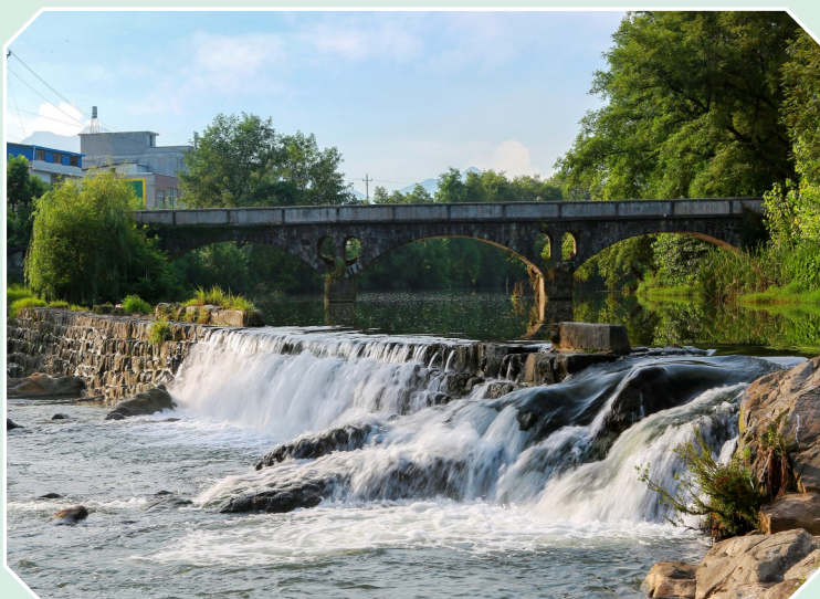
水美乡村 关刀镇八仙村