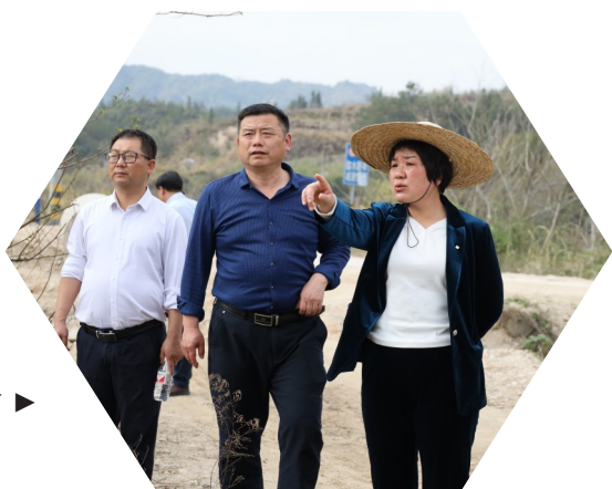
县委书记刘中英巡河▶

作为国家重点生态功能区,通城县以深化河湖长制为主抓手,把管水治水作为流域综合治理的先行之策,聚焦系统管控、重点管理,同心守护好陆水源头,努力实现“河畅、水清、岸绿、景美”目标,让一河碧水滋润两岸民生,滔滔碧波汇入长江。尤其是面对六十年一遇的极端旱情,通城县众志成城,群策群力,连续作战,奋力抗灾,牢牢守住县域生态安全和水安全底线,为通城打造中部地区绿色发展先行区注入不竭活水。