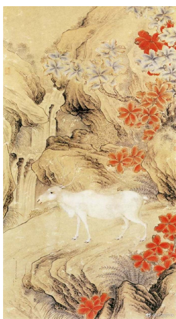
(清)贺清涛《秦鹿图》现藏故宫博物院