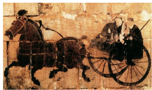
东汉《御车图》身着黑色官服的普通官员 洛阳朱村汉墓壁画