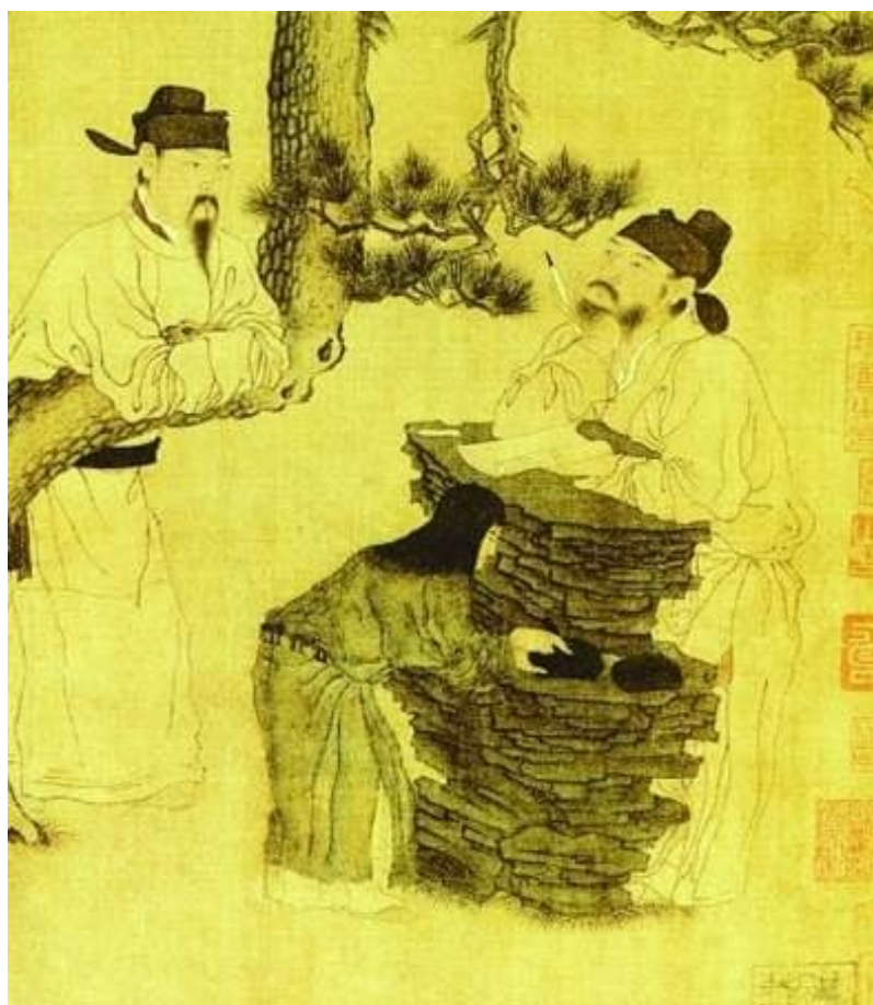
五代周文矩绘《文苑图》中的古人作诗场景(局部)