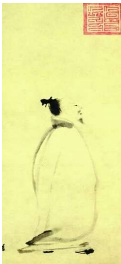
唐朝诗人李白行吟图(传南宋梁楷绘)