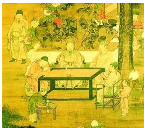
阎立本绘《十八学士图》(局部)