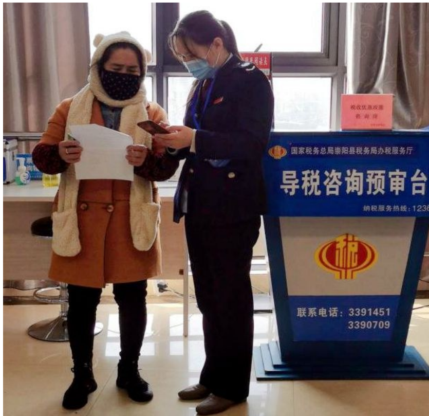
导税人员辅助纳税人代开房屋租赁发票

楚税通APP新上线的功能让房屋租赁代开增值税电子普通发票实现指尖办,并会根据嵌入的业务规则进行前置