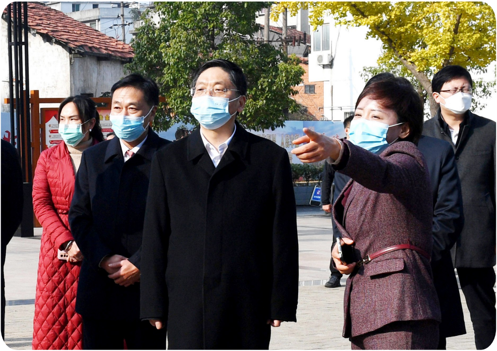
中国红十字会党组书记、常务副会长王可在我市调研

2022年,咸宁市红十字会在省红十字会的大力指导和市委、市政府的坚强领导下,深入学习贯彻习近平新时代中国特色社会主义思想和对红十字工作的重要指示批示精神,围绕省红十字会2022年工作要点和市委、市政府中心工作,聚焦目标任务,深化改革创新,转变工作作风,推动了全市红十字事业高质量发展。