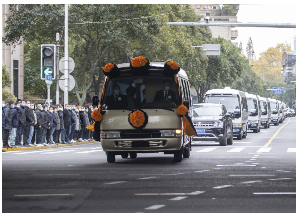
12月1日,江泽民同志的遗体从上海由专机敬移到达北京。这是上海各界群众在沿途送行。据新华社