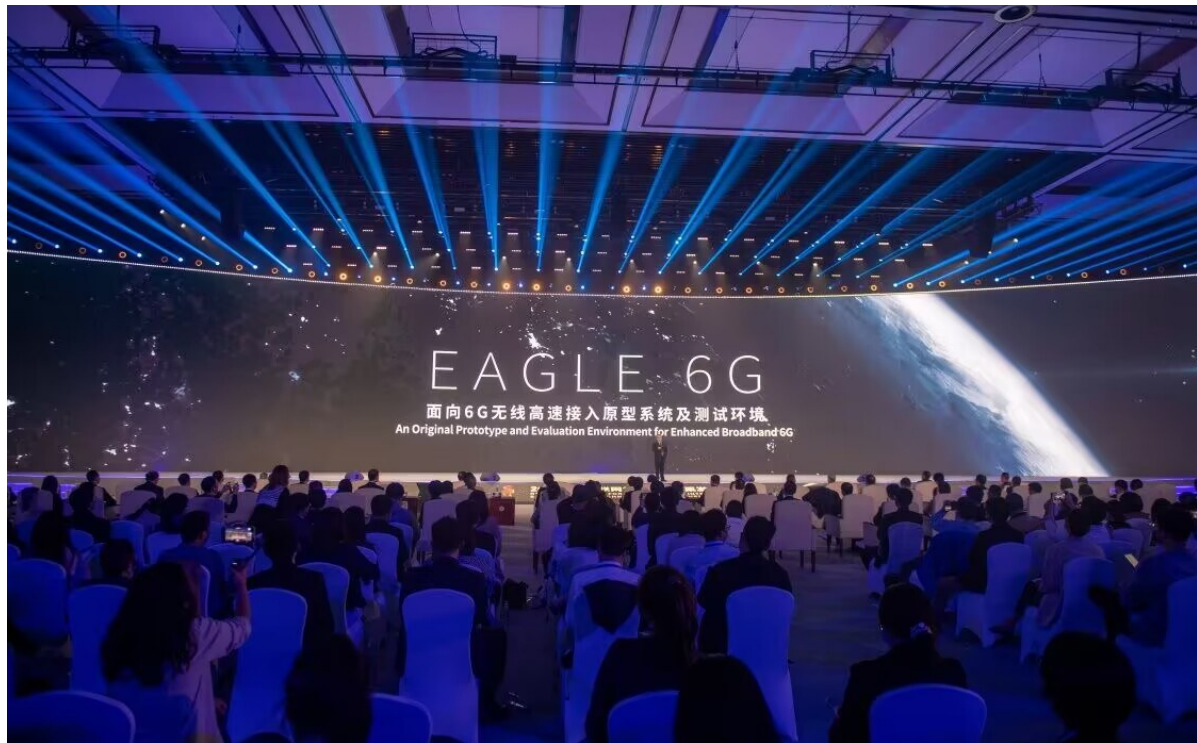
这是11月9日拍摄的“EAGLE 6G:面向6G无线高速接入原型系统及测试环境”发布现场。

外卖骑手的安全问题一直备受关注。饿了么研发的一款集合手机和头盔功能的智能头盔,利用物联网、大数据、人工智能等技术,在设计中加入传感器和硬件模组,一方面可以帮助识别骑手的安全状态,另一方面通过增加语音操作,减少对手机的直接操作,保障骑手人身安全。