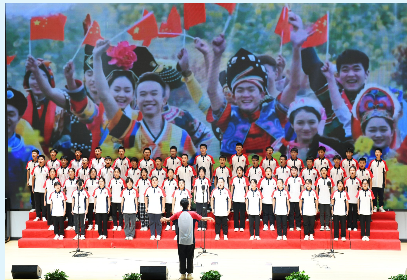
10月26日晚，“奋进新征程 共筑中国梦”——“艺”动青春 我行我“Show”鄂南高中第七届美育节决赛暨闭幕式精彩上演。晚会分为歌声嘹亮众星璀璨、盛世华章、星光闪耀三个篇章。据了解，本届美育节旨在落实立德树人，培养学生核心