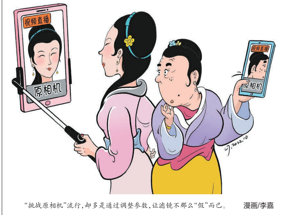
“挑战原相机”流行,却多是通过调整参数,让滤镜不那么“假”而已。