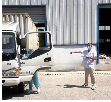
根据疫情防控要求,咸安区疾控中心定期对辖区的农贸市场、大中型商超、交通站点、物流快递、旅游景点、宾馆酒店和综合医疗机构等各行各业,主要是对人员密集和空气密闭型重点场所,涉及进口物品和高风

管,一手拿着取样器对地面进行采样。环境采样重点是门把手、桌(台)面、地面等外部环境进行核酸采样,切实做好“人物同防”。