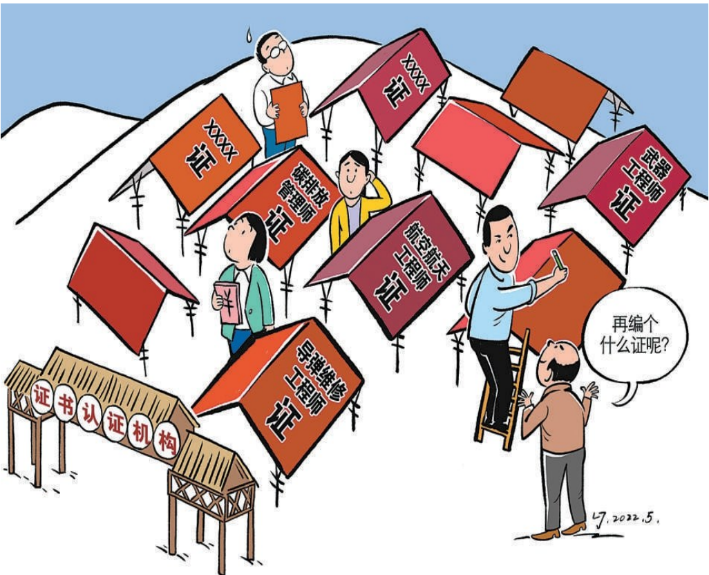
一些机构以新职业培训为名乱收费、滥发证,弄出一堆“山寨证书”。