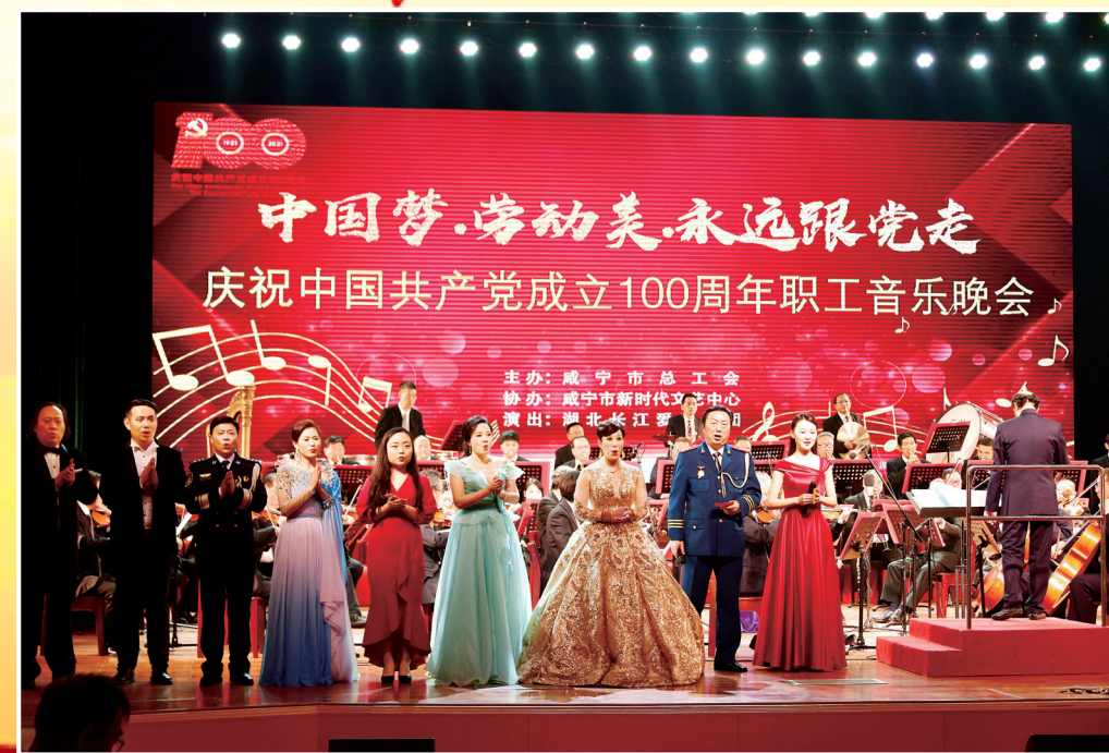
庆祝建党100周年职工音乐晚会