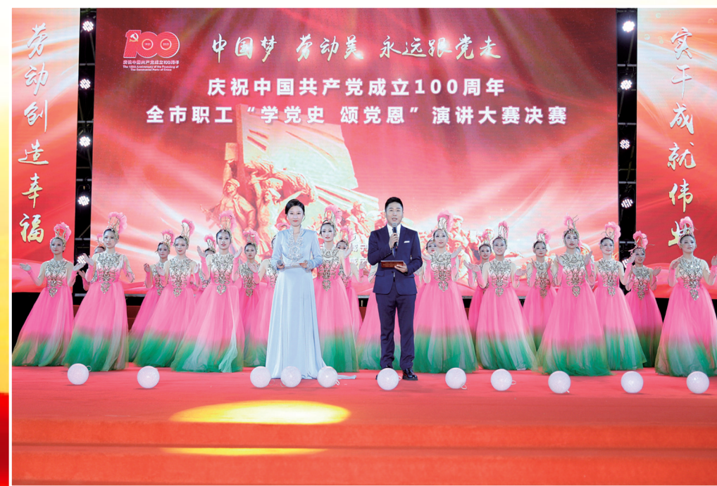
全市职工“学党史 颂党恩”演讲比赛