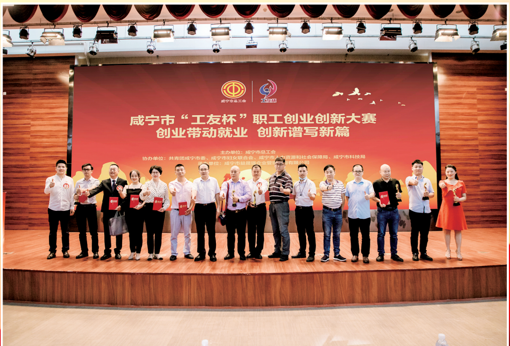
全市职工创业创新大赛