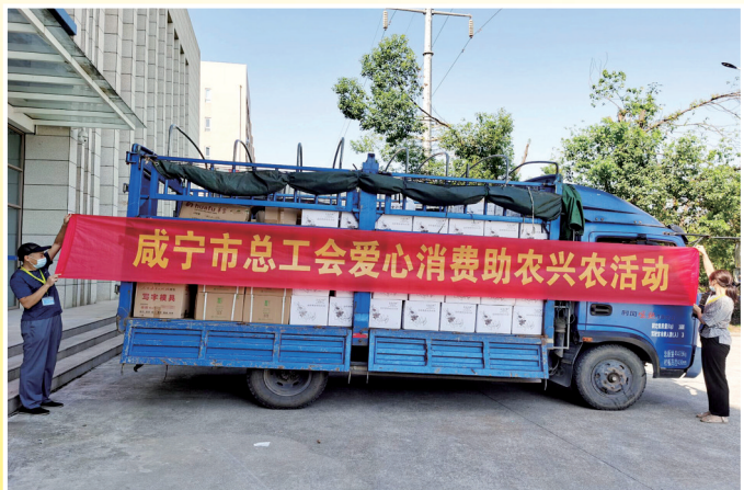
爱心消费助农兴农