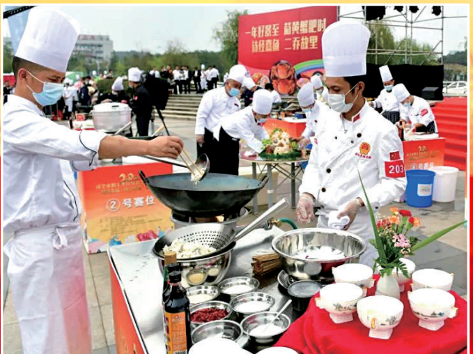
全市职工烹制团圆饭