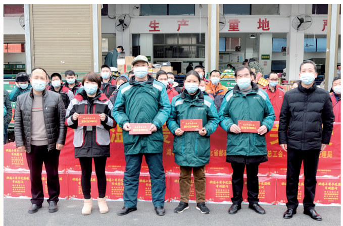
慰问新业态形态劳动者