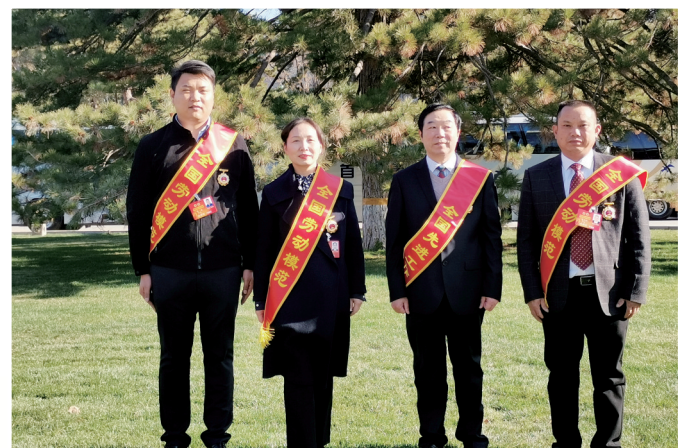
咸宁四名全国劳模赴京接受表彰