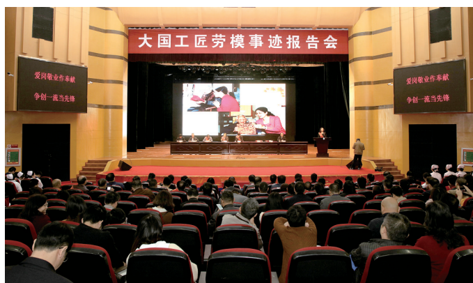
“大国工匠”走进咸宁