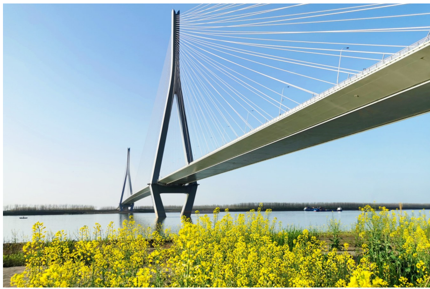
嘉鱼长江大桥下油菜花飘香