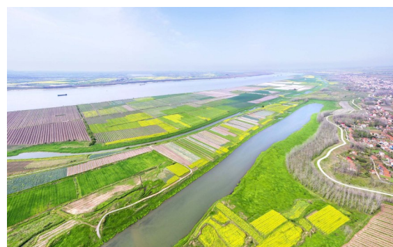
水清草绿天蓝民富