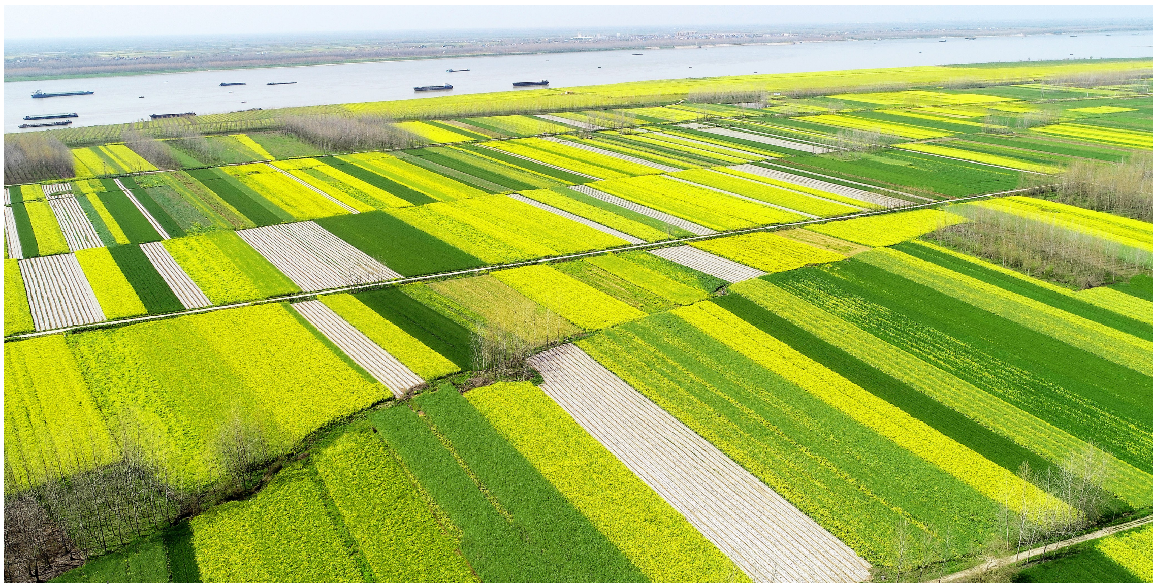
嘉鱼长江岸线春色如画