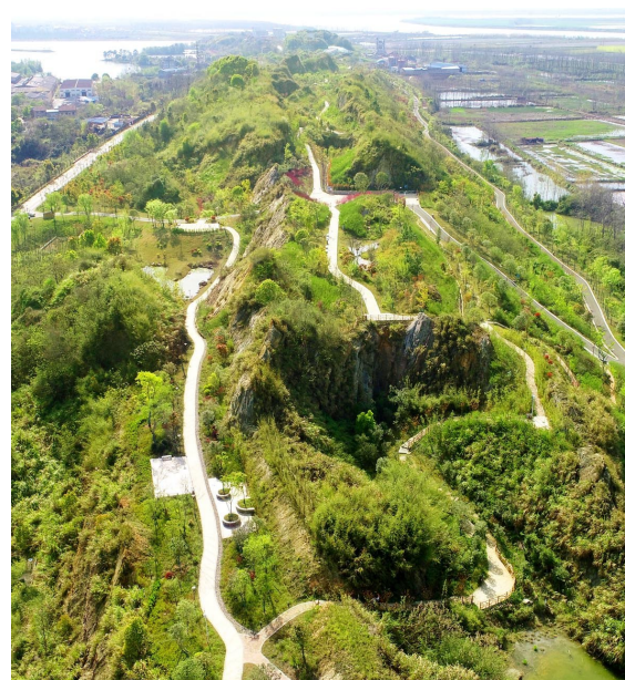
新街镇废弃矿山变身生态公园