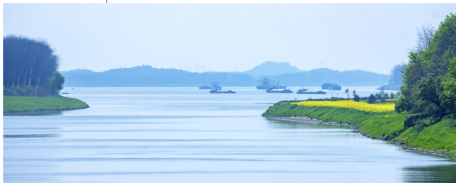
长江黄金水道运输忙

同时,嘉鱼加快实施长江岸线生态环境修复工程,因地制宜打造沿江生态公园和景观带,积极推进咸嘉生态文化城镇带建设;全力推进“一江八水五湖”水系连通工程,推动全域水资源保护与生态修复;持续推进长江十年禁捕,严格落实河湖长制;全力开展沿江排污口综合整治,确保“一江清水东流”。