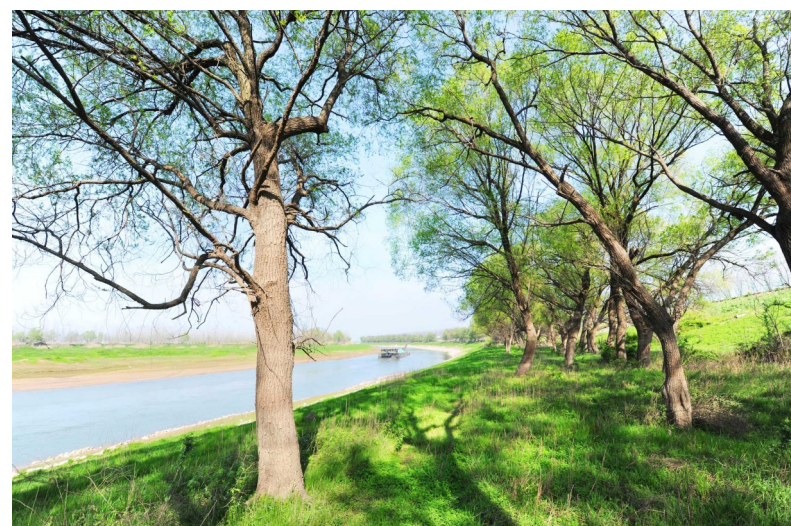
陆溪镇陆水河长江入口春来到