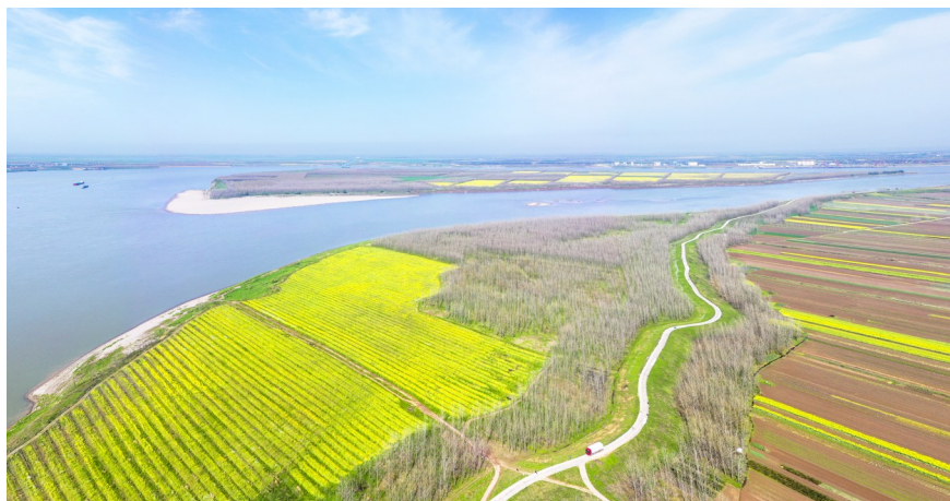
簰洲湾意杨防浪林驻守大堤