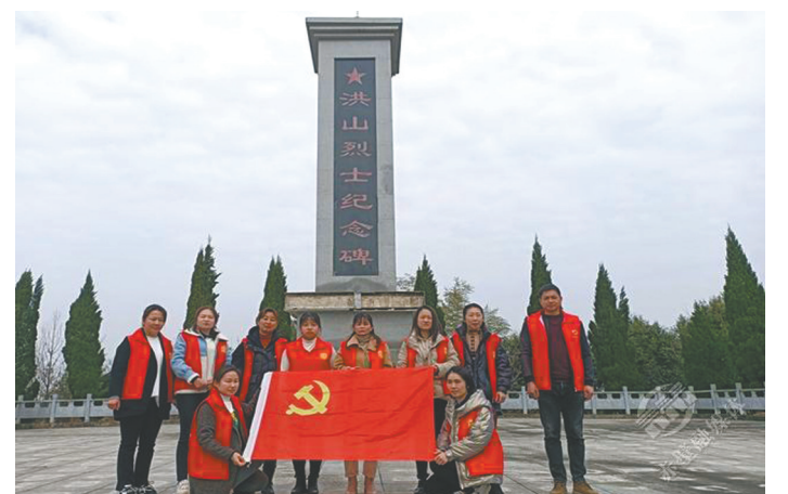
在第112个“三八”国际妇女节来临之际,3日,赤壁市余家桥乡妇联联合新时代文明实践站、退役军人服务站组织全乡妇联干部前往余家桥乡洪山烈士纪念碑开展志愿服务活动。

活动结束后,县公安局妇委会走访慰问了该村困难妇女代表,给她们送上慰问金和节日的祝福,并与大家亲切交谈,深入了解妇女同胞们的生活现状,鼓励她们坚定信心,乐观向上。