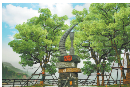
都像一本科普书向游客娓娓道来。 地址:咸宁市通城县大坪乡内冲村 电话:0715-4345666

内冲瑶族村融古瑶文化、(楚汉文化)、中医药文化、红色文化、(自然风光)、生态休闲、民俗风情于一体,是湖北省唯一的瑶族村寨,也是全国51个瑶族特色村寨之一。走进通城县大坪乡内冲瑶族村,独具瑶族特色的大门迎接四方来客,飞檐翘角、亭廊木屋、狗头牛角等瑶族建筑处处是景,步步入画。还未走到瑶望千年广场,只见养心谷民宿和栈道格外显眼。景区内有一座古瑶文化陈列馆,整个瑶族历史文化气息保存得很完整,古瑶文化、古瑶传说以及瑶民的民俗和生活习惯