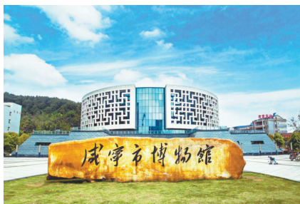
闭馆 电话:0715-8907157 地址:咸宁市咸安区金桂路169号

带着孩子一起去博物馆领略历史人文,感受历史变迁,感叹千年前的经典国粹。咸宁市博物馆是国家二级博物馆,博物馆免费对外开放,近期设有“在家门口看国宝、品味楚文明集萃”——湖北省博物馆馆藏精品文物展。70余件国家级珍品文物皆陈列于此,让大家一饱眼福,其中还有湖北省博物馆展出的“元青花四爱图梅瓶”和“崇阳铜鼓”。