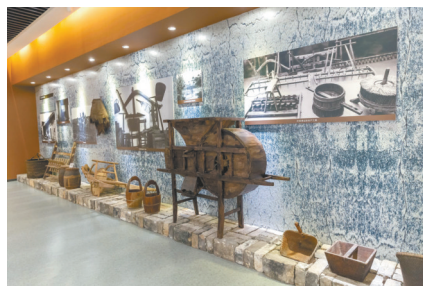
控制系统,运用物联网技术实现远程控制,可视化管理。到这里可以真正探索现代农业种植的奥秘。 地址:咸宁市嘉鱼县田野大道 电话:0715-6716999

田野乡村公园拥有丰富的研学旅行资源,近日被评为湖北省第二批中小学生研学实践营地。田野乡村公园将通过“闻”、“找”、“摸”、“看”、“听”等自然教育手段,帮助孩子们打开五感,去放松心情、体会自然,感受农业科技的力量。园内的田野农博馆朴实大气庄重,农博馆保存了许多有深刻意义的老照片,进入馆内可以了解官桥村八组改革发展史,学习村民们自强不息的奋斗精神,深切感受中国改革开放40年来的优秀成果。在开心农场,能够更好地感受农业高新科技成果。农场智能化联动玻璃温室,采用大数据智能管理系统,精准环境