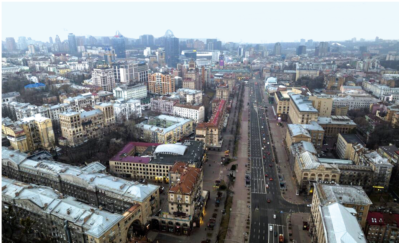
这是2月24日拍摄的乌克兰基辅的街景。