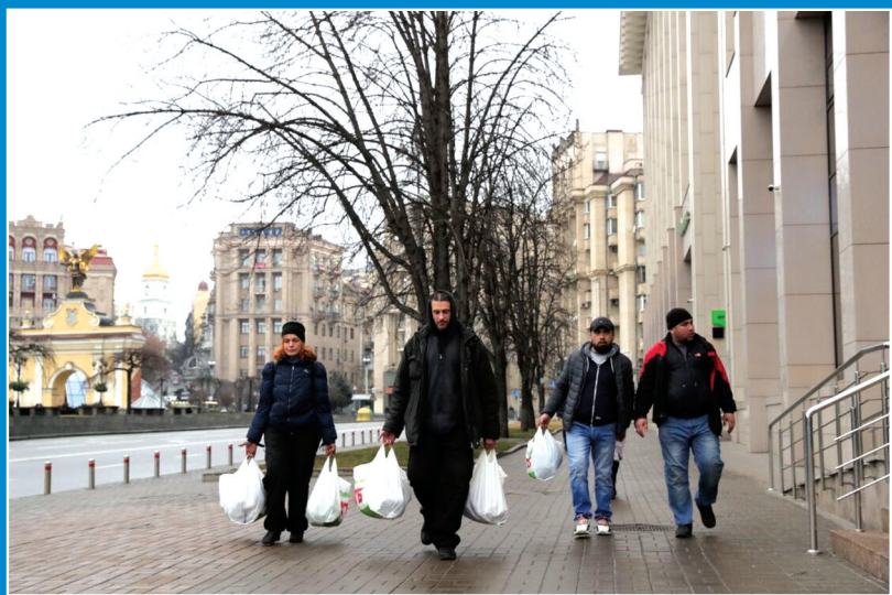
2月24日,在乌克兰基辅,当地居民拎着采购的物资走在街道上。