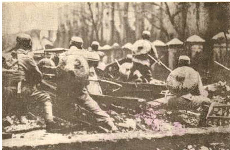
驻防闸北的第十九路军奋起反击

第十九路军曾经驻扎过江西,认同中国共产党提出的“枪口一致对外”。蔡廷锴、蒋光鼐等人联名发表《告十九路军全体官兵同志书》与《敬告淞沪民众书》,提出“宁为玉碎而荣死,不为瓦全而偷生”,强调“愿与我亲爱之淞沪同胞携手努力,维持必要之治安,做最后有秩序之决斗,绝不使日兵在中国土地及淞沪万国俱瞻之范围,扰