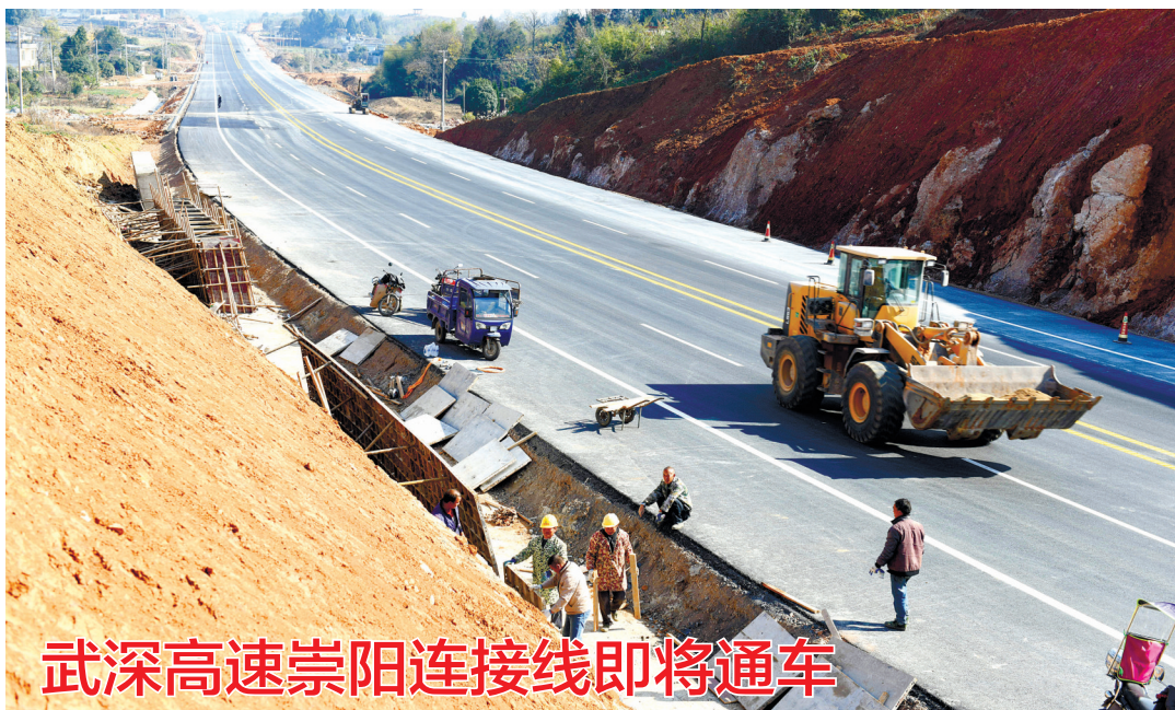
武深高速崇阳连接线即将通车

12月10日,嘉鱼县潘家湾镇产业新城园区,湖北南合汽车饰件有限公司生产车间里,工人们正忙着赶制订单。据了解,该公司主要从事汽车内饰、外饰、空滤等塑料件及出风口功能件、包覆件的开发、生产、销售等。目前,公司积极拓展市场,已与东风、神龙、日产、本田、广汽等主机厂配套,产销两旺。