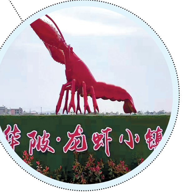
文字:马丽娅 余辉

“青山水”是崇阳最好的水。华陂村充分发挥当地农田和水资源优势，创新“三化”方式，发动农户投工投劳，从2016年开始，华陂村盘活废弃老河床和农田资源，把能人“请回来”，让服务“走下去”，采取“村集体+合作社+农户”合作模式，成立专业合作社3家，发展“稻虾共养”产业，截至目前，全村已建成基地近2000亩，带动周边吴城、雷骆、塘桥、铺前等村“稻虾共养”基地近4000余亩，建设清水龙虾和澳洲虾养殖园3000亩，提供就业岗位800余个。 该镇将依托全镇“稻虾”产业和池塘荷花产业，在华陂办好龙虾节、赏荷活动，在丰富村民文化生活的同时，推进三产融合发展，力争将华陂打造成集龙虾、吃虾+荷花观赏、莲子采摘、荷叶茶文化、休闲娱乐为一体的“龙虾小镇”。 南林村党支部将始终把水产养殖抓在手中，不断扩大精养鱼池规模，完善配套设施。2019年引进甲鱼养殖项目，投资2500万元建成亲鳖池5000平方米，稚鳖池5000平方米，幼鳖池8000平方米，成鳖池8000平方米，建设甲鱼仓库3000平方米，甲鱼排粪水沟500平方米。完善配套水电、通信等基础设施。目前甲鱼基地效益良好，名声在外，甲鱼供不应求，年收入上千万元。