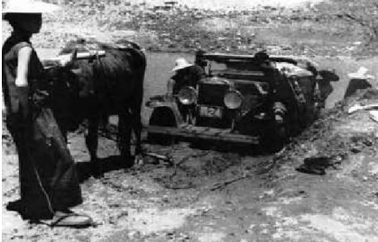
外国来访者的车陷入洛河,被老黄牛拖出

不仅呈现了早期中国共产党人的容貌风采、精神信念和理想光芒,更是从一位西方学者客观和切实的角度,证明了中国共产党的使命初心、中国革命的正义性和取得辉煌成就的历史必然性。毫无疑问,这是一本极具党史价值和现实意义的好书,是我党在延安时期革命实践和思想理论的重要见证,因其独特的视角和客观详尽的内容,堪称一部被新发现的《红星照耀中国》。