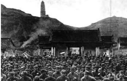
延安开会听外国来访者讲课

安之行,无疑是千载难逢的采访良机。本书最大的价值是作者对朱德、周恩来、毛泽东的采访。在亲密无间的融洽氛围中,作者与这些中国革命的旷世奇才开诚布公地交换了意见,他与朱德谈论红军的军事力量,向周恩来请教国共统一战线的进展,与毛泽东纵论中国及世界局势。毕森所记录下的在延安那一场又一场谈话之中,的确看到了这些人中卓越不凡的领袖气质和前瞻性、判断力,其最为突出的特色,便是中国革命领袖们令人震撼的清晰思维和远见卓识。作为共产党的领袖之一,毛泽东在判谈形势的时候会考虑到苏联、美国、英国等世界大国,他洞悉了美国为什么要进入中国、为何会支持国民党的深刻背景。在当时的背景下,回顾中国共产党的理念、理想,尤为难能可贵。回眸1937年,共产党的这些领袖,就能放眼全球而规划中华民族的未来,真是令人叹为观止。