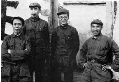
毛泽东、周恩来、博古(秦邦宪)、朱德

1937年6月,在斯诺的帮助下,毕森与其美国同行悄悄奔赴延安。在艰辛之旅中,他亲眼见证了当年中国社会的动荡现实与革命圣地的烽火岁月,并将历经坎珂抵达延安后采访红军领袖们的见闻用铅笔记录在两个笔记本上。除了文字之外,书中还刊登了一些难得一见的照片,有从西安到延安的沿途景象,有延安根据地的日常生活,尤其难得的是捕捉到许多正值盛年的中国共产党领袖们的英姿。书中这些珍贵的笔记和照片,