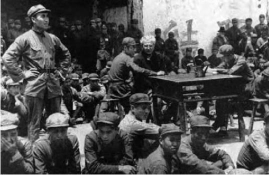
外国来访者演讲前,朱德做开场白

作者毕森坦言:“在一个稍纵即逝、千载难逢的良机,得以对延安投去惊鸿一瞥,堪称幸运。”他们从延安返回之后仅5天,卢沟桥事变爆发,全国抗日战争开始。之后不久,毕森回到美国。本书