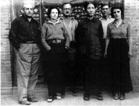
毛泽东与毕森(右二)等外国来访者在延安