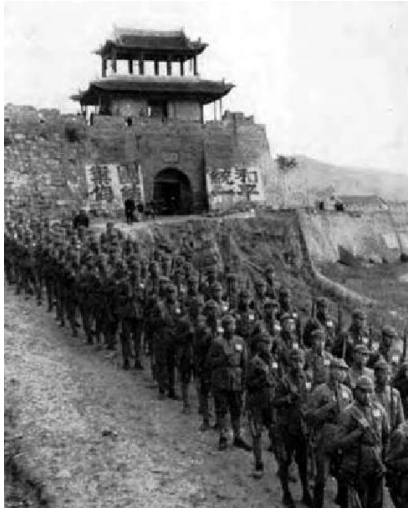
延安城门,城墙上的标语:和平统一,团结御侮