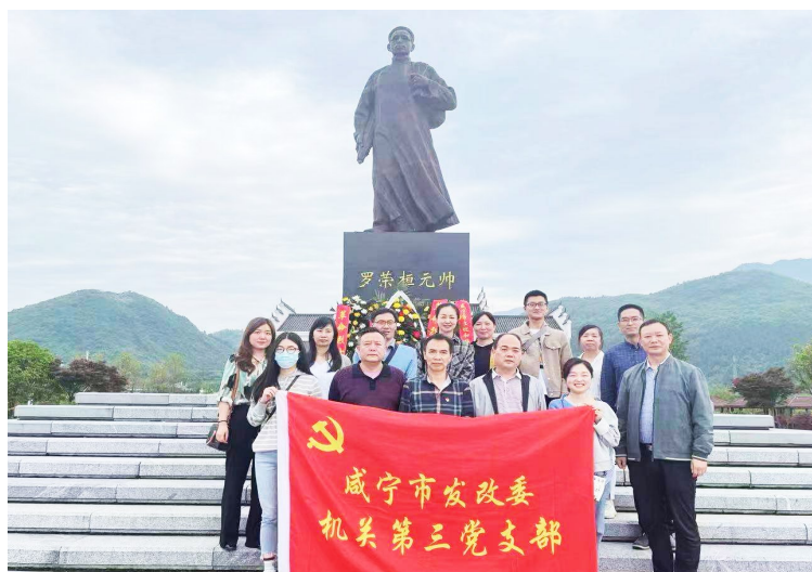
参观通城县塘湖镇红色小镇罗荣桓纪念馆

党史如明灯,照亮前行之路;党史如号角,激发奋进之力。党史学习教育开展以来,市发改委从历史、理论、现实、发展四个维度,夯实思想之基、铸就信仰之魂、增强斗争之力、强化担当之责,把党史学习教育作为践行初心使命的“磨刀石”、校准理想信念的“定盘星”、筑牢全面从严治党的“压舱石”、推进高质量发展的“动力源”。