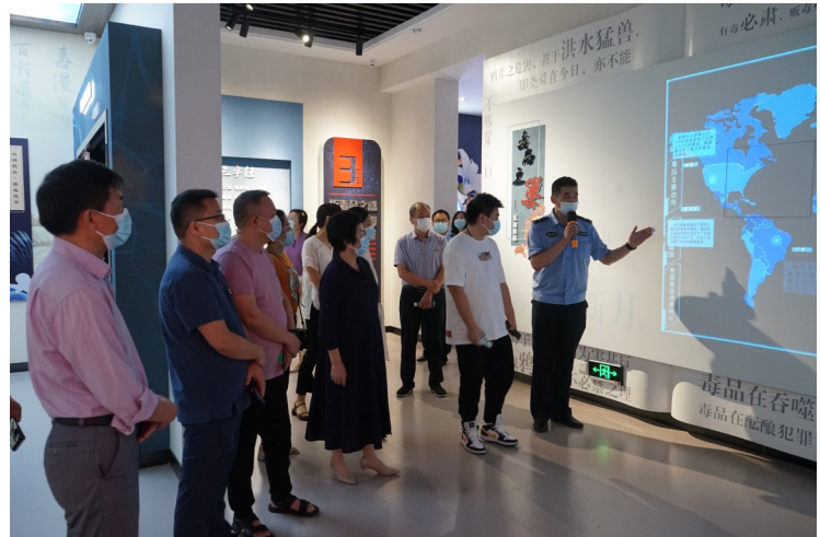
参观市禁毒警示教育馆