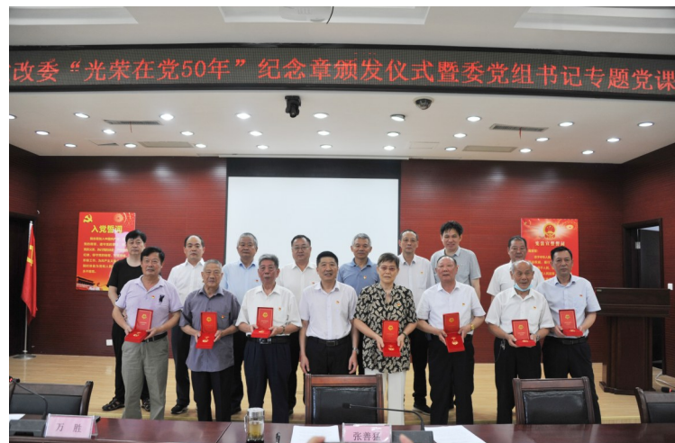
“光荣在党50年”纪念章颁发仪式暨委党组书记专题党课