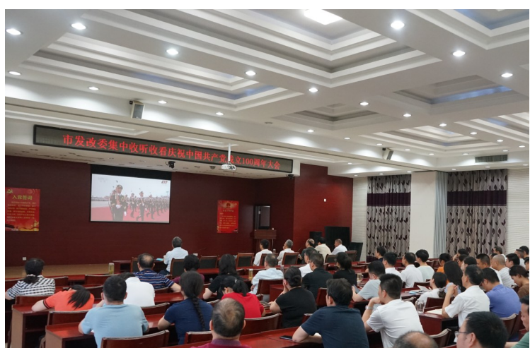
市发改委集中收听收看庆祝中国共产党成立100周年大会