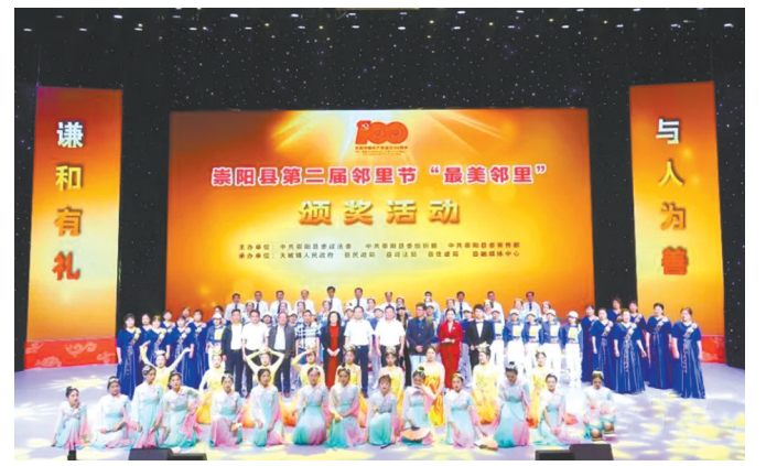
举办“崇阳县第二届邻里节”