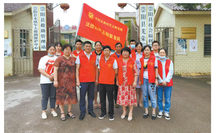
政法干警到福利院送爱心