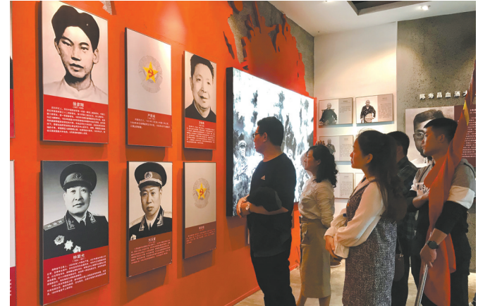
县委政法委全体干部职工参观通城秋收暴动纪念馆