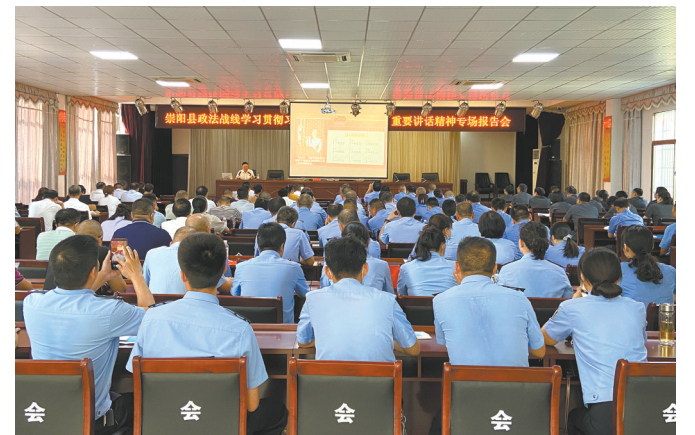
全县政法干警集中学习充电