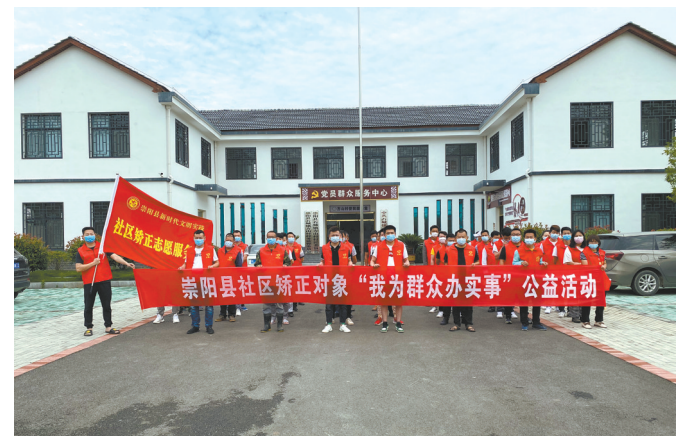
县司法局开展为民办实事活动