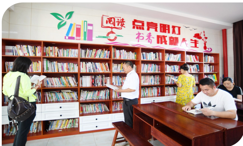
官埠渡船村读书角