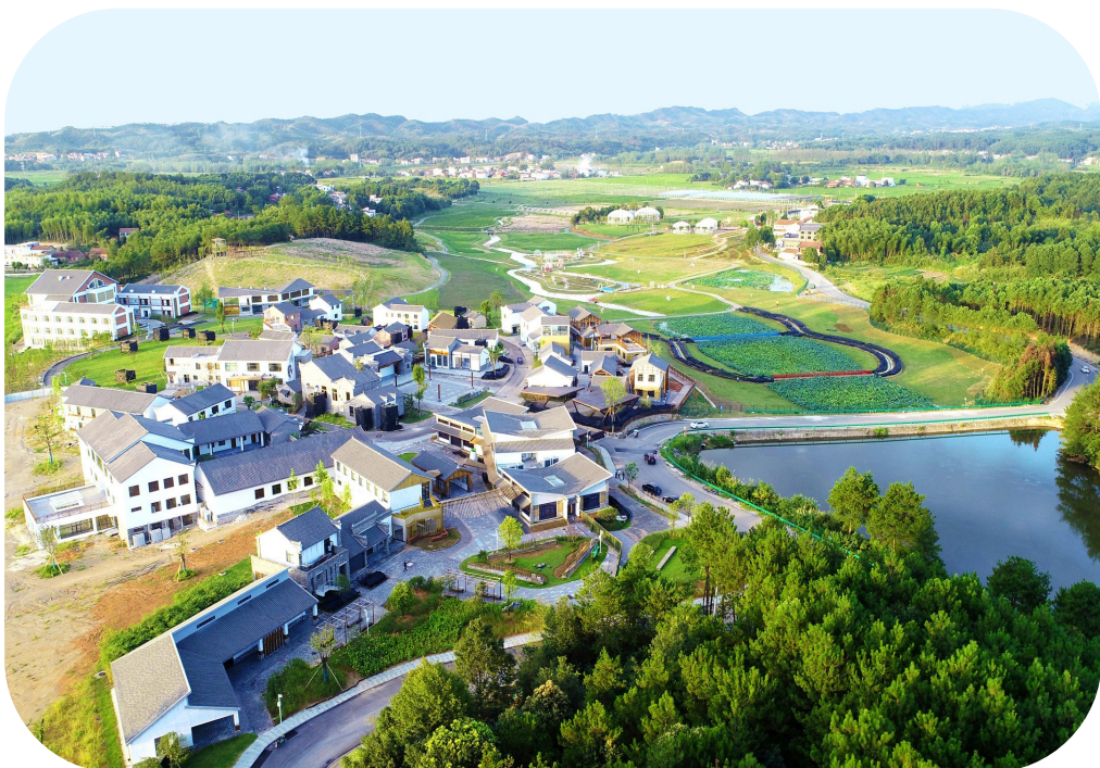
咸安高桥萝卜小镇