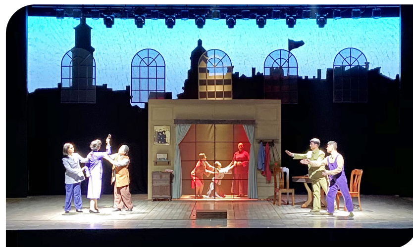
《钱娘和她的亲人们》剧照