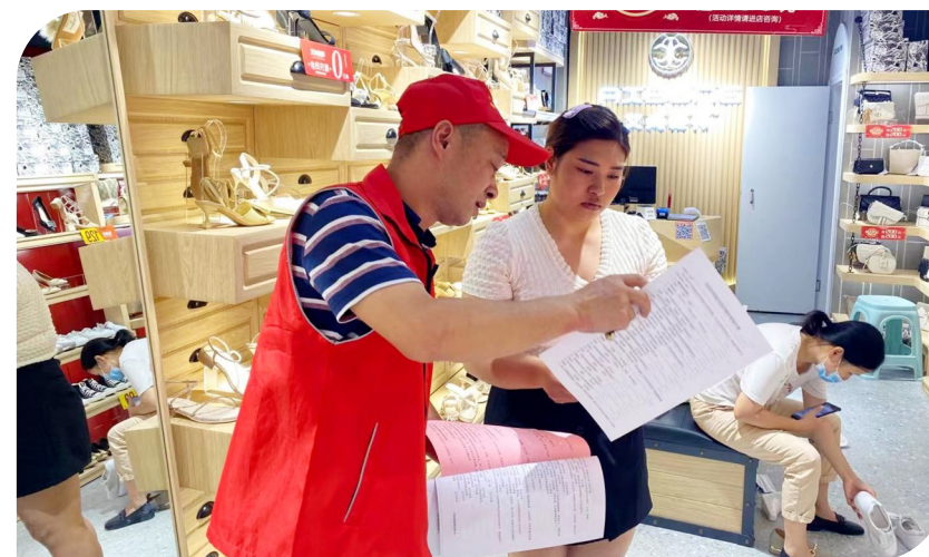
为流动党员寄送“红色包裹”