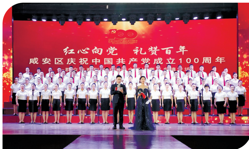
咸安群唱红歌颂党恩