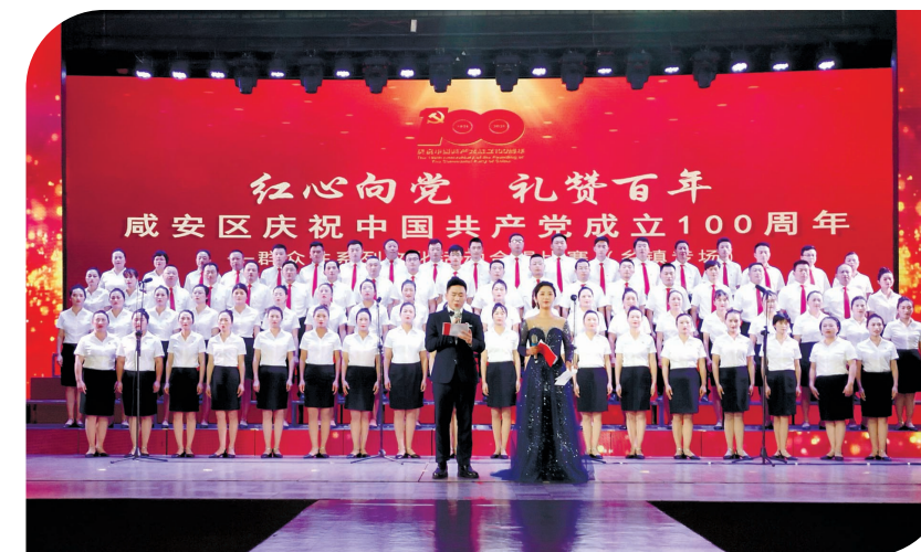
咸安群唱红歌颂党恩