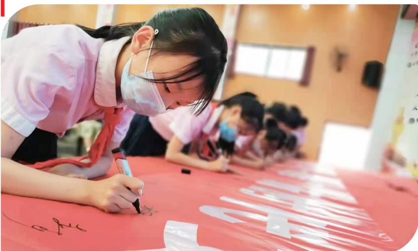
“小手拉大手 文明一起走”实践活动

突出“做”字,强化为民服务。一是推进利民办实事。服务新冠疫苗接种,组织全区52支党员干部联系社区工作队、555名社区工作者、126支驻村工作队、542名村干部下沉网格(小区)和村组入户宣传政策,组织居民接种,截至6月20日全区已实现新冠疫苗接种38.41万剂次,组织87家单位党员干部开展社区困难慰问行动,走访慰问特困人员等特殊群体3253人,赠送了价值60万元的生活物资。二是解决问题办实事。聚焦抓安全生产,邀请安全管家对园区143家企业进行全覆盖检查,发现136处安全隐患,交由包保干部督促整改。聚焦解决信访矛盾,区级领导带头接访下访,接待群众5批32人次,下访约访信访群众281人次,解决信访问题64个,化解信访积案48件。比如,温泉街道投入1000余万元实打实解决一批“急难愁盼”民生问题。三是服务中心办实事。围绕全国文明城市创建,组织党员干部持续开展清洁咸宁、文明交通劝导、万人洁城、问卷调查等志愿服务活动。围绕党建引领基层治理,健全完善街道“大工委”、社区“大党委”联席会议制度,推行需求、资源、项目“三张清单”,定期开展协商议事活动,累计解决基层治理痛点难点问题328个。