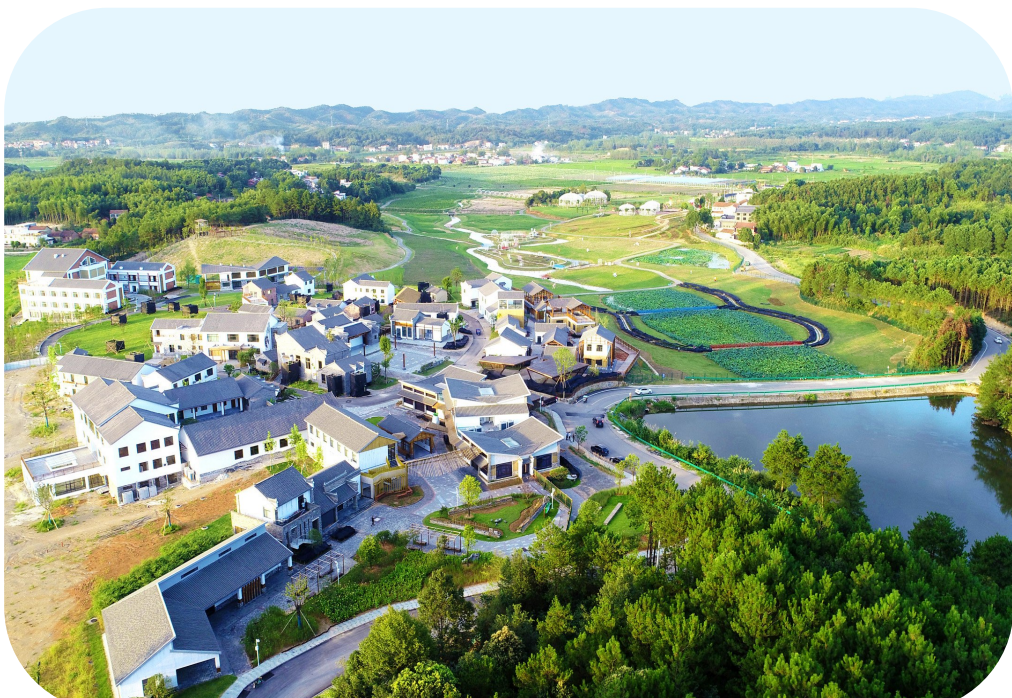
咸安高桥萝卜小镇