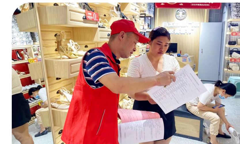
为流动党员寄送“红色包裹”