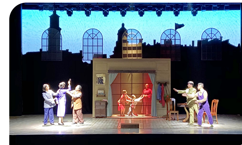
《钱娘和她的亲人们》剧照