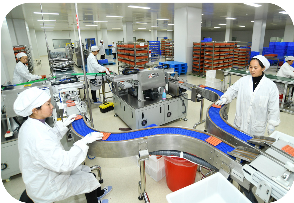
真奥药业新生产线