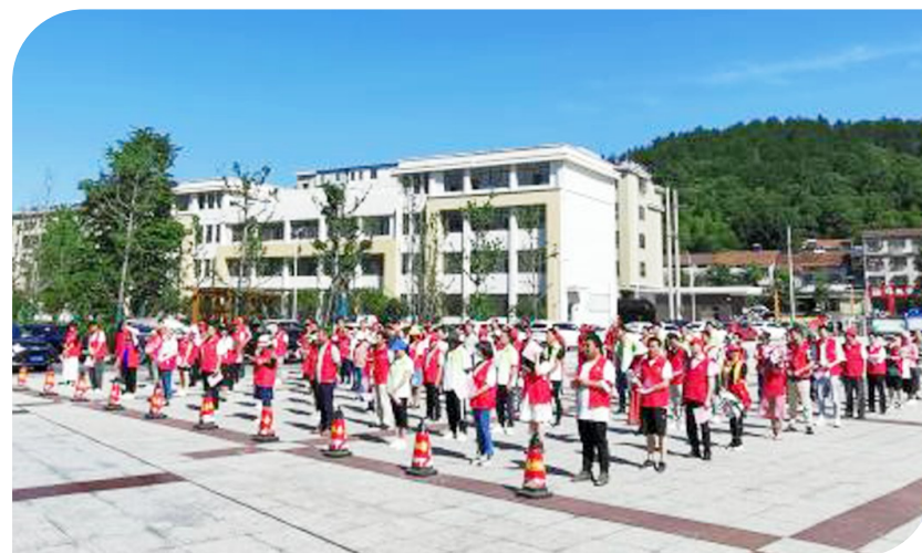
“百年百街行,传递大文明”创文行动