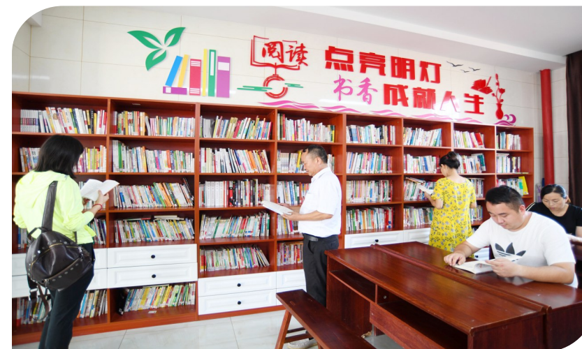
官埠渡船村读书角