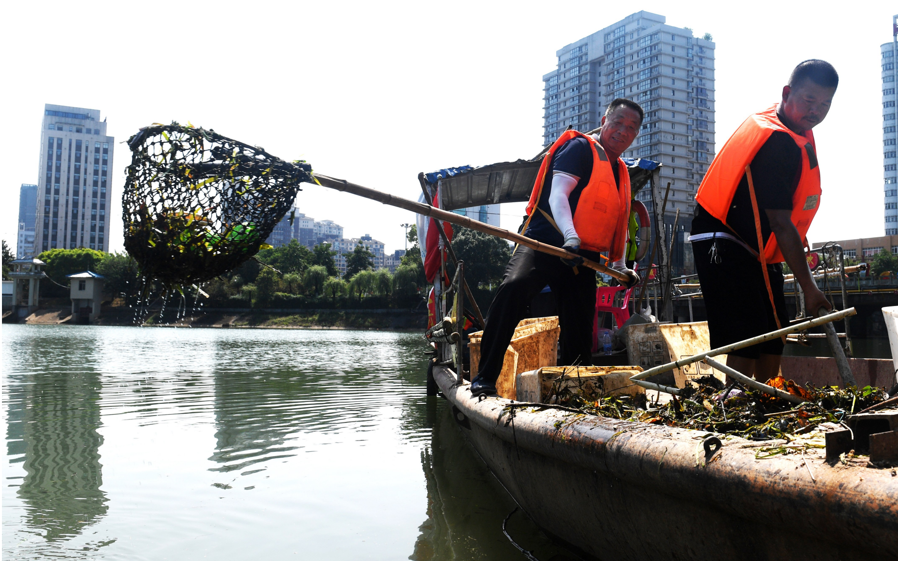
日复一日年复一年的水上坚持,换来一河碧水

虽刚过夏至,但香城气温却一路飙升,骄阳似火,酷暑难耐。但淦河水面上,却有一支顶着烈日,泛舟河道的打捞队,他们接力守护,焕新的是母亲河的容颜,留下一河碧水沁心田。