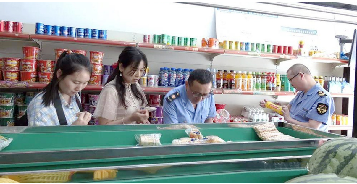
县市场监管局督查食品饮食安全

至目前,县市场监管局共出动执法人员225人次,执法车辆36台次,清查各类场所125处,下达责令改正通知书26份,取缔无证无照经营户6户,引导15家流动摊贩到指定地方经营。