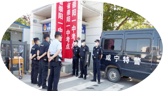
公安特警守护安宁

鸿鑫驾校负责人告诉记者。据悉,自2016年以来,鸿鑫驾校已连续6年为崇阳高考考生提供爱心免费接送服务,共出动车辆400余台(人)次,免费接送考生1236人次安全、准时送达考场。