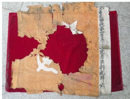
(实行礼拜六革命竞赛红旗咸安区博物馆藏)

1985年,原咸宁市(现咸安区)双溪桥镇文化站获悉,高铺子河村农民在拆旧房时,从墙缝中发现一面残损的红旗。该旗长78.5cm、宽72.5cm,材质为土布纺织品,重100g。白布边上墨书“中国共产党鄂城第一区第三支党员实行礼拜六”。红旗上方书“实行革命竞赛”,右上角和左下角分别用白布绣五星和镰刀、锤子。2003年,经省文物鉴定委员会专家鉴定,该旗为大革命时期中共党组织每星期六劳动评比的流动竞赛红旗,是近现代文物,现为咸安区博物馆馆藏一级文物,是鄂南苏区现存最早的一面红旗。