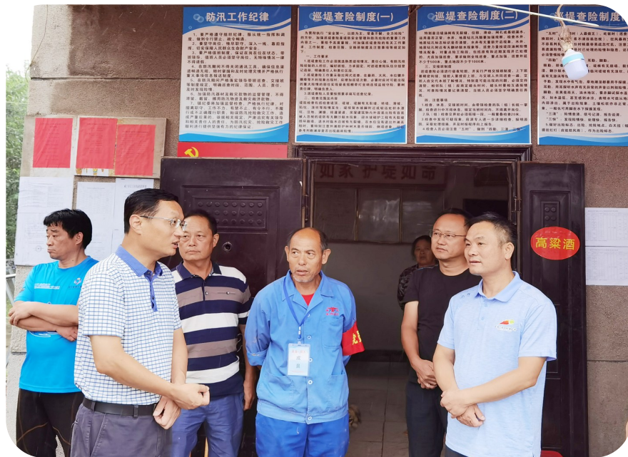
市人大常委会副主任、县委书记胡春雷来鱼岳镇调研