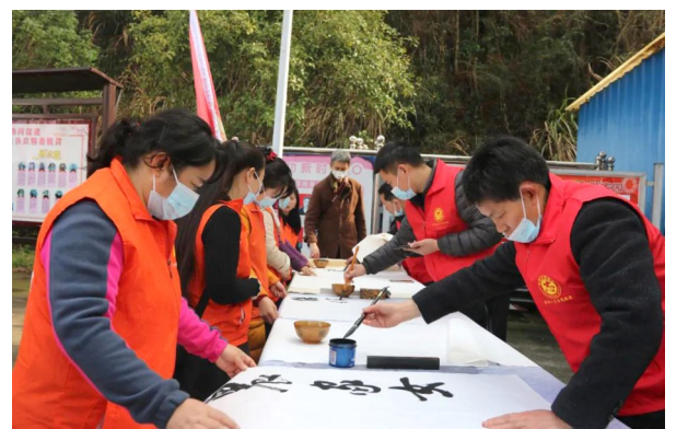
3月12日,在“浪漫樱花 幸福崇阳”2021年中国崇阳第二届樱花节活动现场,志愿服务队开展文艺志愿服务活动,营造了浓浓的传统文化氛围。