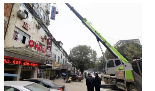
城管执法人员组织大型机械拆除违规宣传牌