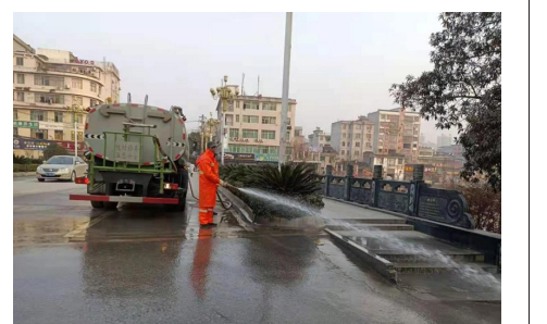
环卫工人冲洗人行道

“十四五”规划已经开篇布局,征途漫漫,惟有奋斗,通山县将紧紧围绕县委、市政府决策部署,强化措施,继续奋斗,推动城市管理工作再上新台阶,以良好的城市环境造福群众,助推经济社会高质量发展。