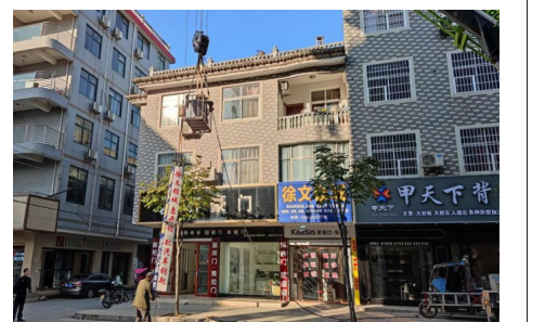
城管执法人员组织拆除高空一店多招宣传牌