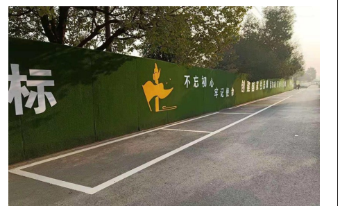
洋都大道阮家湾段新建绿植围挡