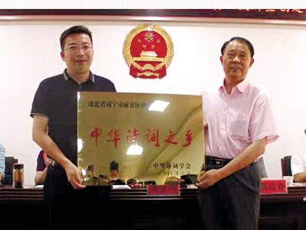
获评“中华诗词之乡”“中国楹联文化镇”

交通建设:按照全镇农村公路列养计划,不仅完成了计划内道路安全生命防护工程与农村危桥改造、“四好农村路”项目建设,还启动了横沟桥镇三级客运站项目建设,并已完成了主体工程。