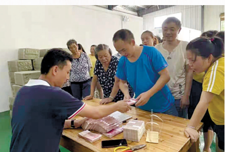
扶贫车间就业增收