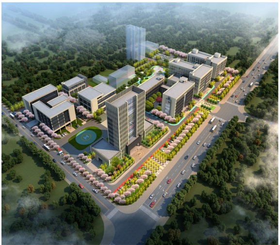
高标准疾控体系建设项目