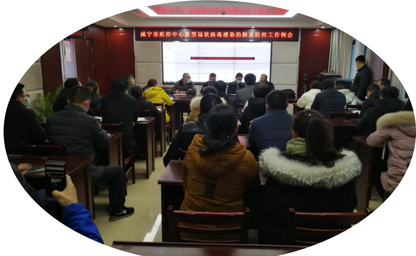
疫情防控工作例会

进入冬季,随着天气慢慢变冷,海外疫情不断恶化。为落实常态化疫情防控各项措施,应对可能发生的新冠肺炎疫情,部署年前重点工作,12月2日,市疾控中心召开冬春季新冠疫情防控工作动员部署会。中心将进一步加强内部人员培训,提升专业素养;进一步做好应急物资储备,强化应急保障能力;进一步落实新冠肺炎疫情应对专班制度,在冬春季新冠疫情防控工作中,为全市人民的生命健康提供最有力的保障。