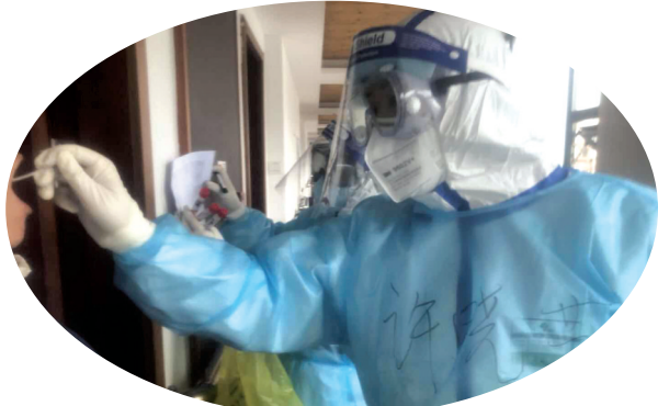
市疾控中心疫情突发防控队员对疑似病人进行咽拭子采样